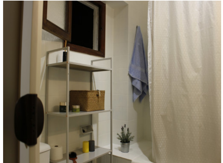
Eines von 2 Badezimmern