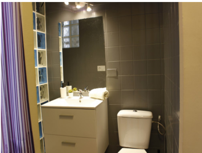
Eines von 2 Badezimmern