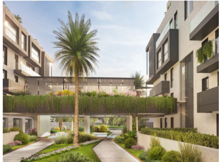
Schön bepflanzter Gemeinschaftsbereich