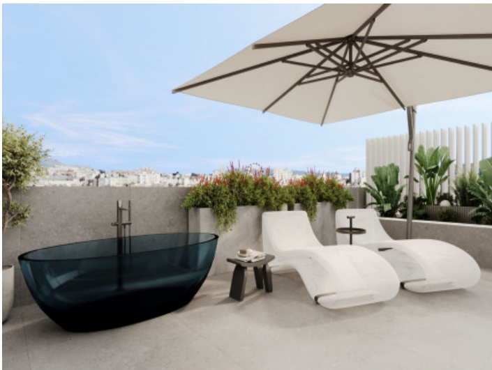
Loungebereich auf der Dachterrasse