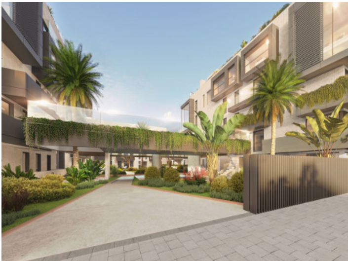
Zugang zum Gebäude