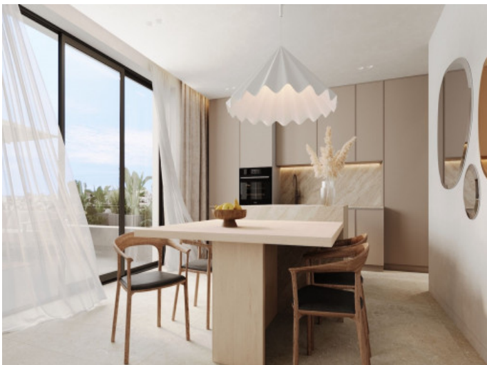
Offene Küche und Essbereich