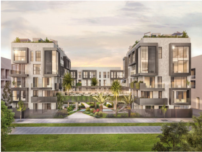
Außenansicht der Anlage