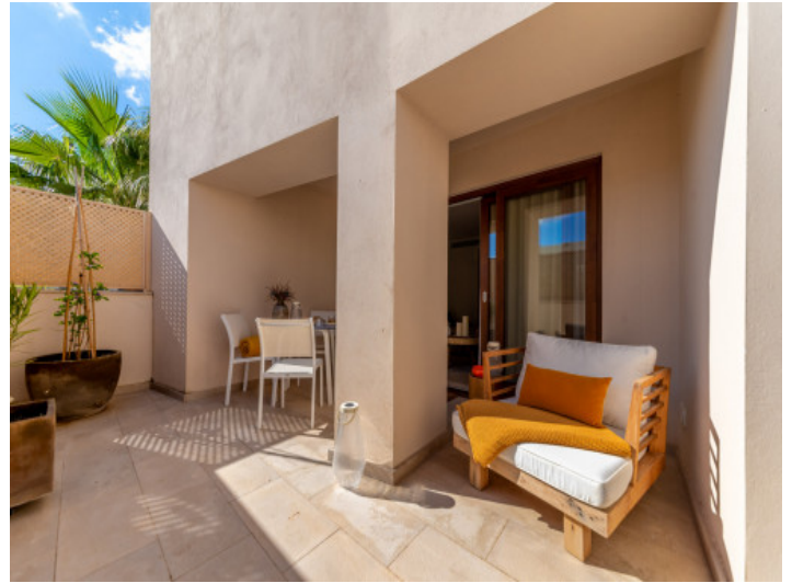
Private Terrasse mit Lounge