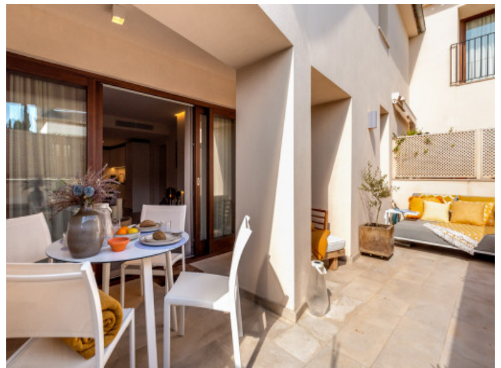
Teilweise überdachte Terrasse

Alle Angaben nach bestem Wissen. Irrtum und Zwischenverkauf vorbehalten. Dieses Exposé ist eine Vorinformation, als Rechtsgrundlage gilt allein der notariell abgeschlossene Kaufvertrag.