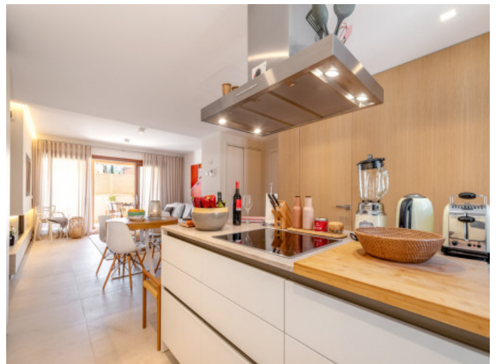
Küche mit Kochinsel

Alle Angaben nach bestem Wissen. Irrtum und Zwischenverkauf vorbehalten. Dieses Exposé ist eine Vorinformation, als Rechtsgrundlage gilt allein der notariell abgeschlossene Kaufvertrag.