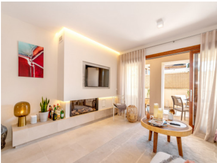
Wohnzimmer mit Kamin