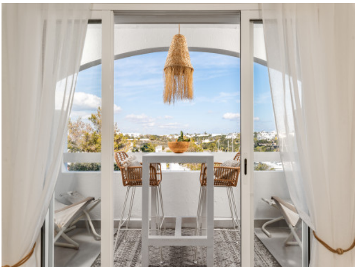
Zugang zum Balkon