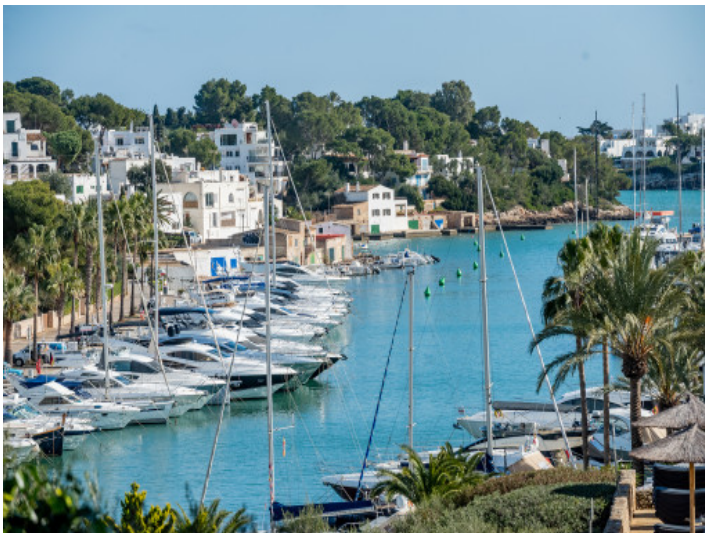
Meer- und Hafenvblick