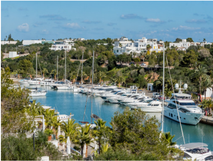
Beeindruckender Blick auf den Hafen