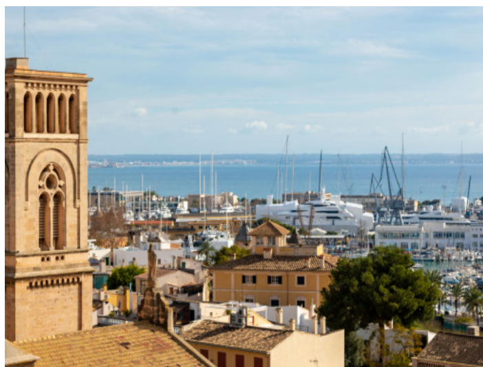
Wundervoller Blick über die Bucht von Palma