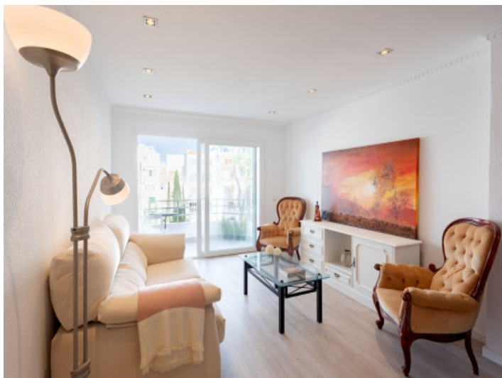
Wohnbereich mit Balkon