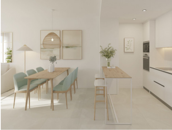
Offener Wohnbereich mit Küche