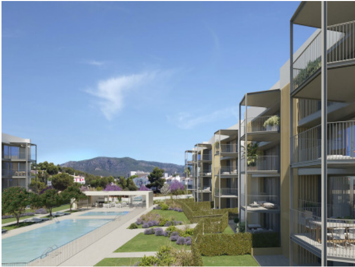
Neubauwohnung mit Gemeinschaftspool in Palmanova