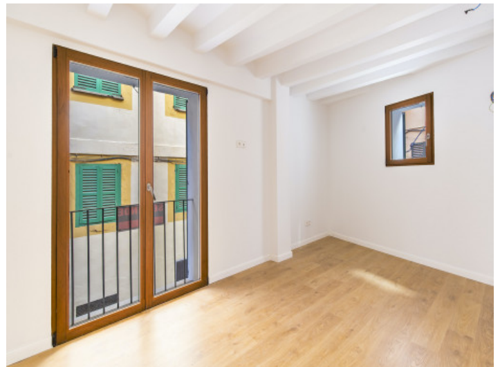
Ansicht des Schlafzimmers