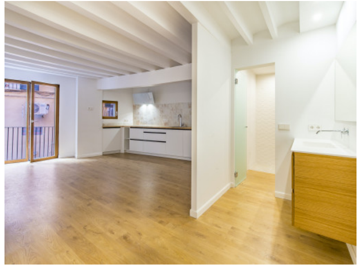
Offener Wohnbereich und Küche