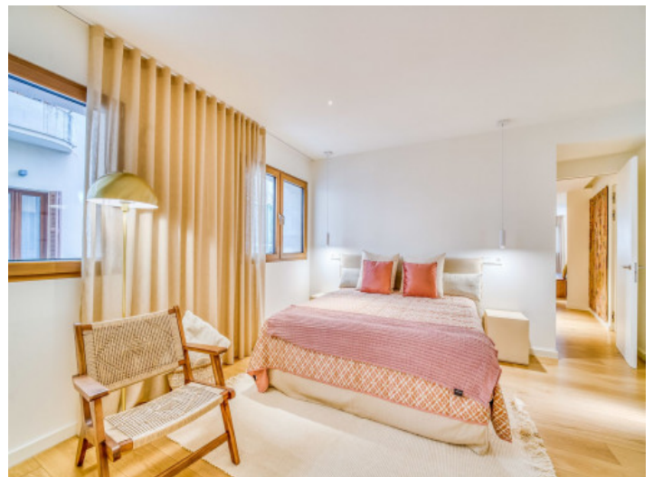
Die Wohnung hat 2 Schlafzimmer

Alle Angaben nach bestem Wissen. Irrtum und Zwischenverkauf vorbehalten. Dieses Exposé ist eine Vorinformation, als Rechtsgrundlage gilt allein der notariell abgeschlossene Kaufvertrag.