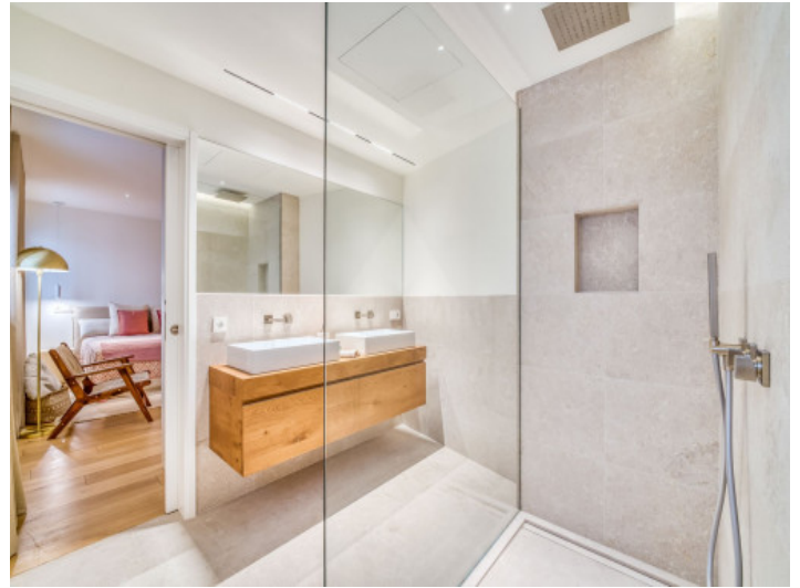
Badezimmer mit bodentiefer Dusche