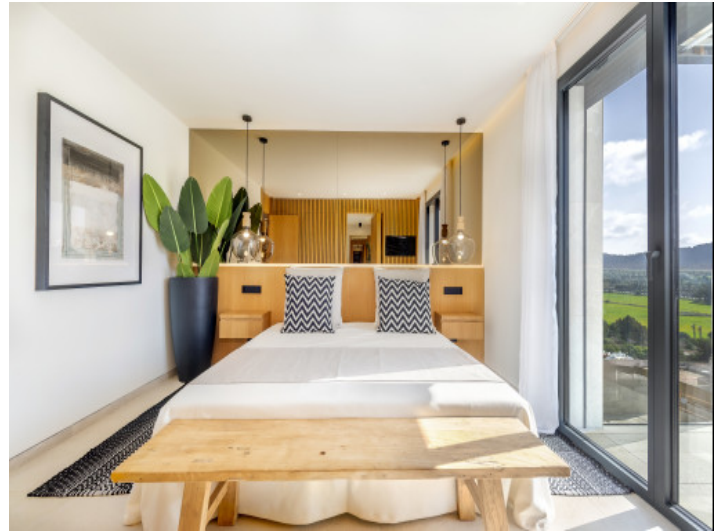
Eines von 4 Schlafzimmer