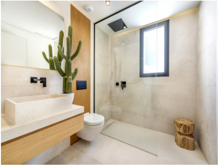
Badezimmer 2 Grup Vial