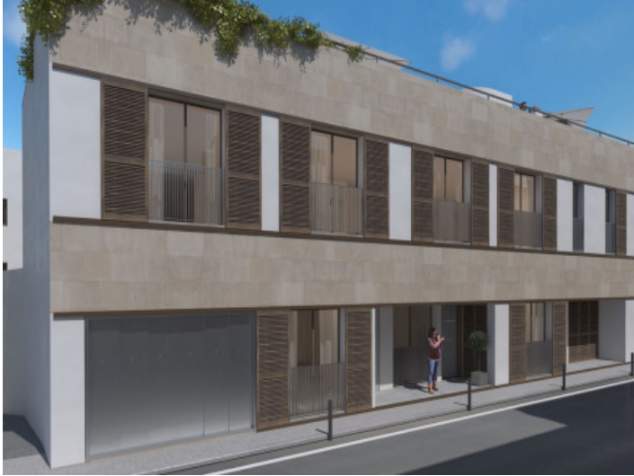
Außenansicht des Wohnhauses