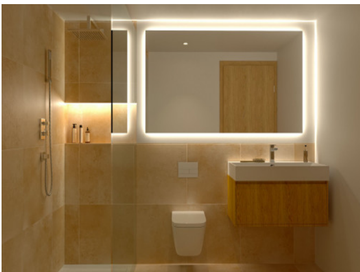
Badezimmer mit ebenerdiger Dusche