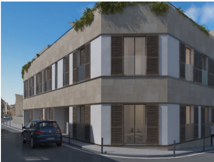
Erdgeschoss Wohnung in Palma