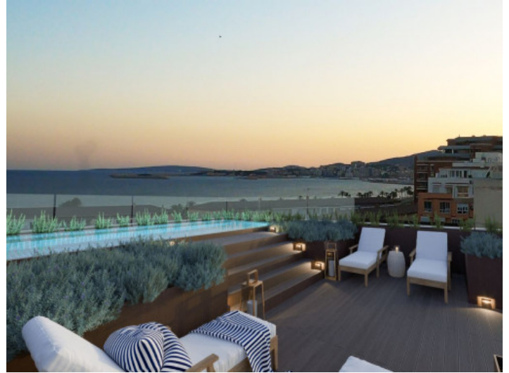
Terrasse, Pool und Meerblick

Alle Angaben nach bestem Wissen. Irrtum und Zwischenverkauf vorbehalten. Dieses Exposé ist eine Vorinformation, als Rechtsgrundlage gilt allein der notariell abgeschlossene Kaufvertrag.