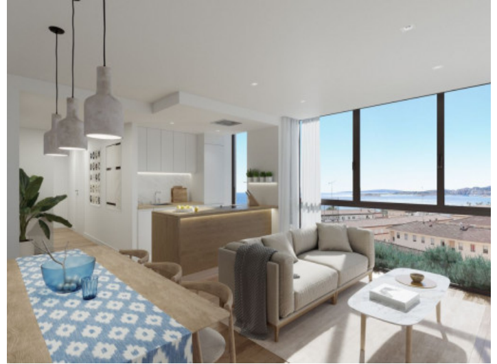
Offener Wohn-, Ess-, und Küchenbereich