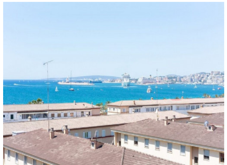
Fantastischer Blick zum Meer

Alle Angaben nach bestem Wissen. Irrtum und Zwischenverkauf vorbehalten. Dieses Exposé ist eine Vorinformation, als Rechtsgrundlage gilt allein der notariell abgeschlossene Kaufvertrag.