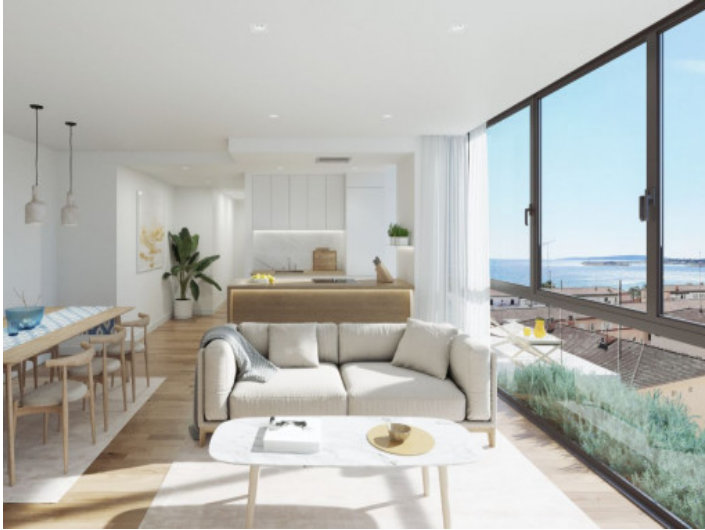
Offener Wohn-, Ess-, und Küchenbereich