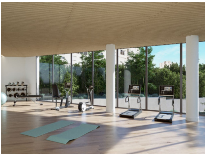
Fitnessstudio im Erdgeschoss