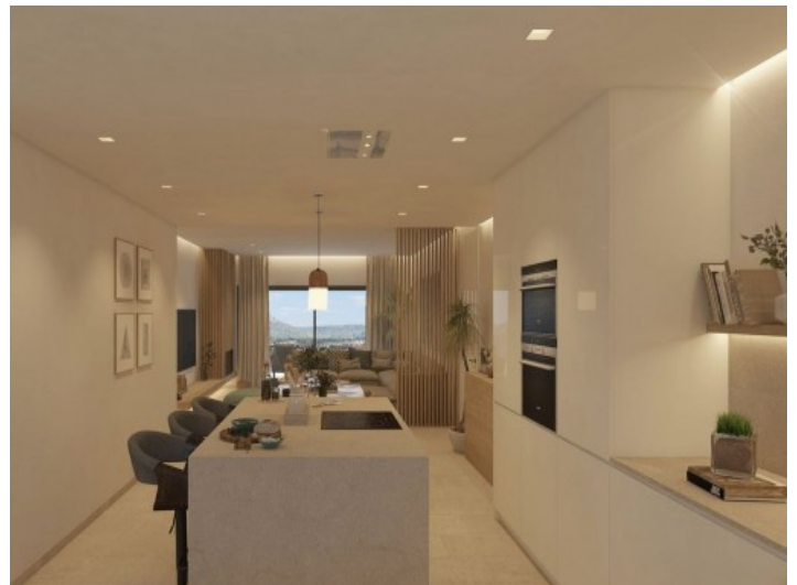
Offene, moderne Küche