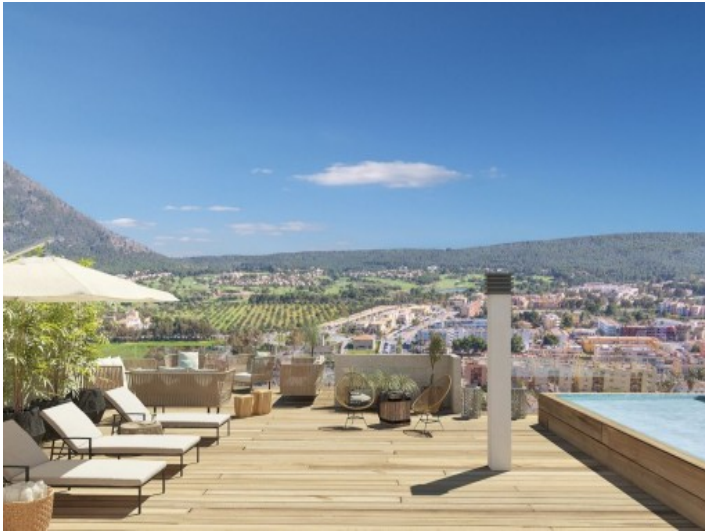
Terrasse mit Sonnenliegen