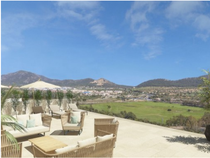
Sonnterrasse mit Ausblick