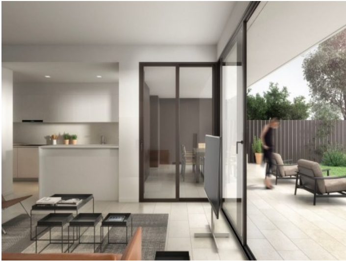
Wohnbereich mit Zugang zum Garten