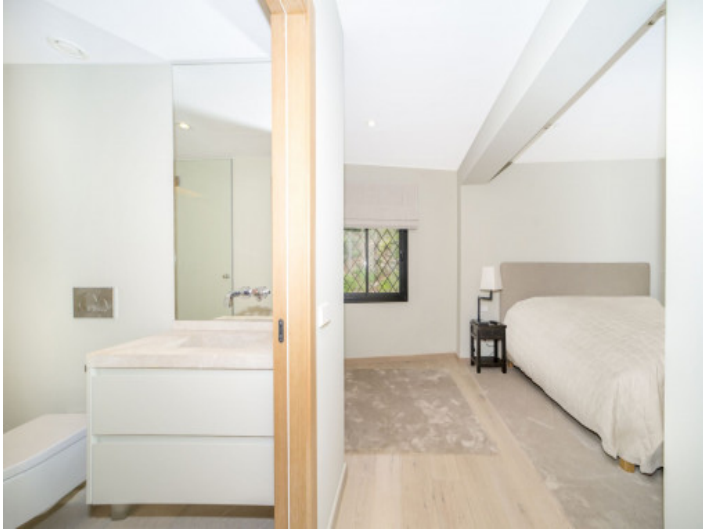
Schlafzimmer mit en Suite Badezimmer