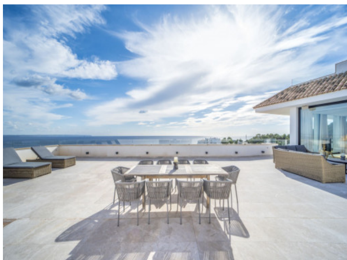
Dachterrasse mit Meerblick