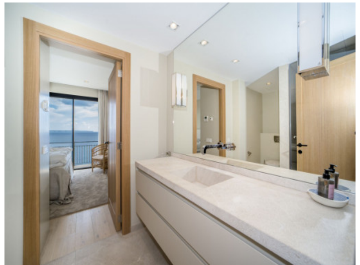
Badzimmer en Suite