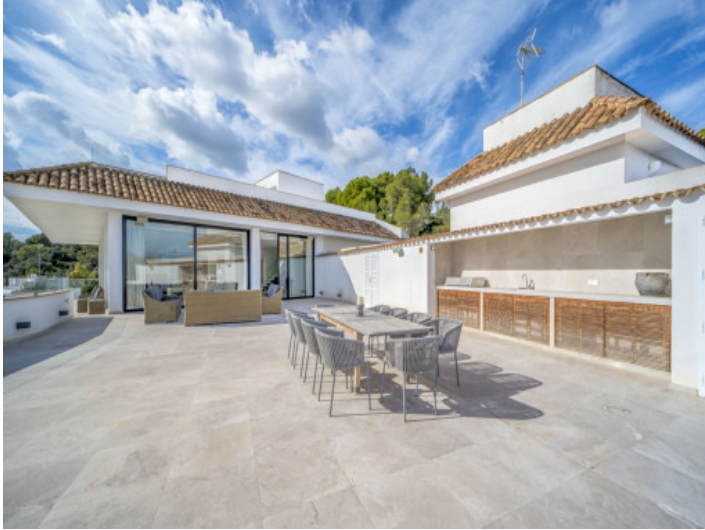
Dachterasse mit Aussenküche