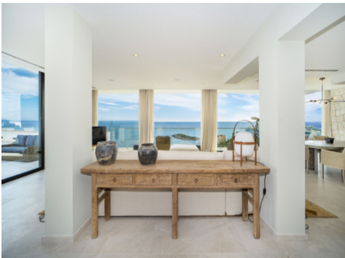
Wohnbereich mit frontalem Meerblick