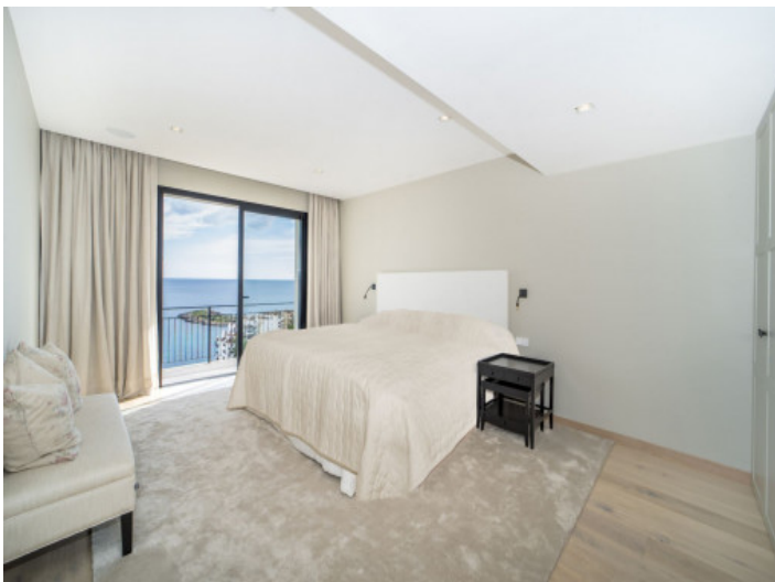
Ein weiteres Schlafzimmer