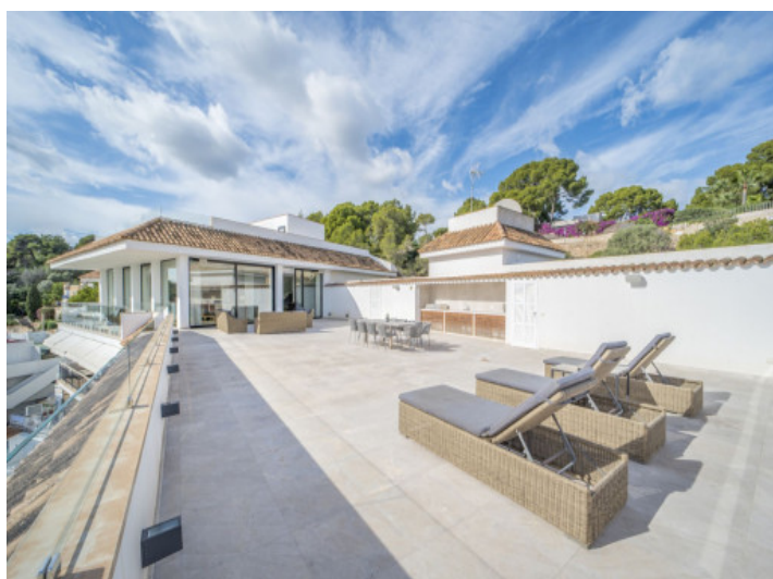
Dachterrasse mit Aussenküche