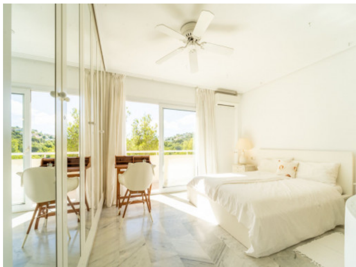
Eines von 2 Schlafzimmer