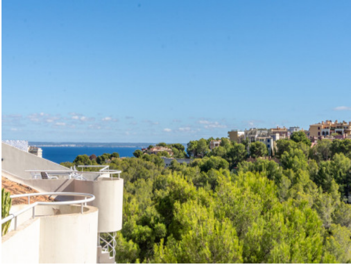
Weitblick von der Dachterrasse