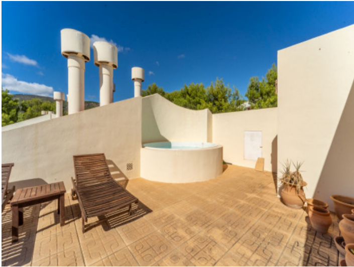
Dachterrasse mit Whirlpool