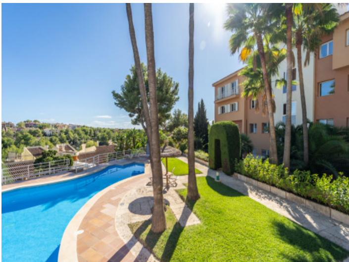
Ansicht auf das Gebäude

Alle Angaben nach bestem Wissen. Irrtum und Zwischenverkauf vorbehalten. Dieses Exposé ist eine Vorinformation, als Rechtsgrundlage gilt allein der notariell abgeschlossene Kaufvertrag.