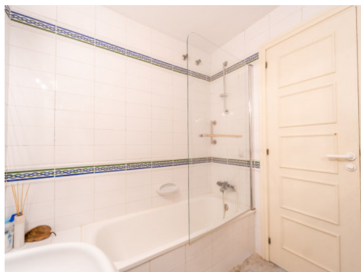
Das zweite Badezimmer

Alle Angaben nach bestem Wissen. Irrtum und Zwischenverkauf vorbehalten. Dieses Exposé ist eine Vorinformation, als Rechtsgrundlage gilt allein der notariell abgeschlossene Kaufvertrag.