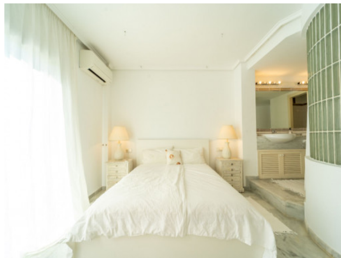
Mastersuite mit Badezimmer en Suite