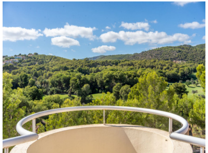
Aussicht auf die Natur und Golfplatz