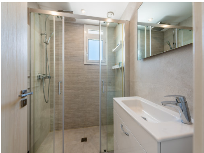
Das 2. Badezimmer