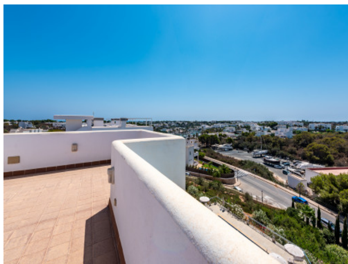
Weitblick auf den Hafen von Cala d'Or