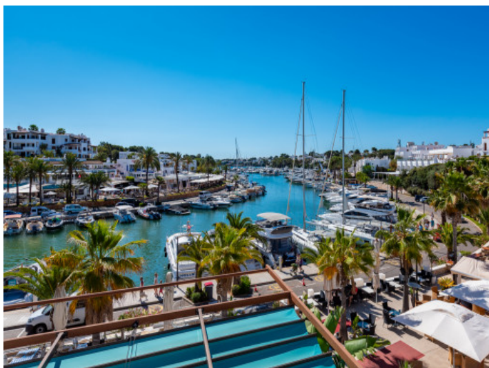
Hafen von Cala d'Or