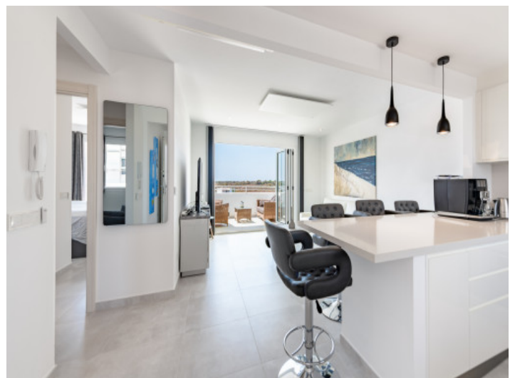
Blick von der Küche in den Wohnbereich

Alle Angaben nach bestem Wissen. Irrtum und Zwischenverkauf vorbehalten. Dieses Exposé ist eine Vorinformation, als Rechtsgrundlage gilt allein der notariell abgeschlossene Kaufvertrag.