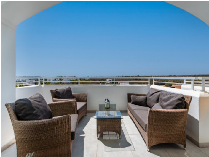
Terrasse am Wohnbereich