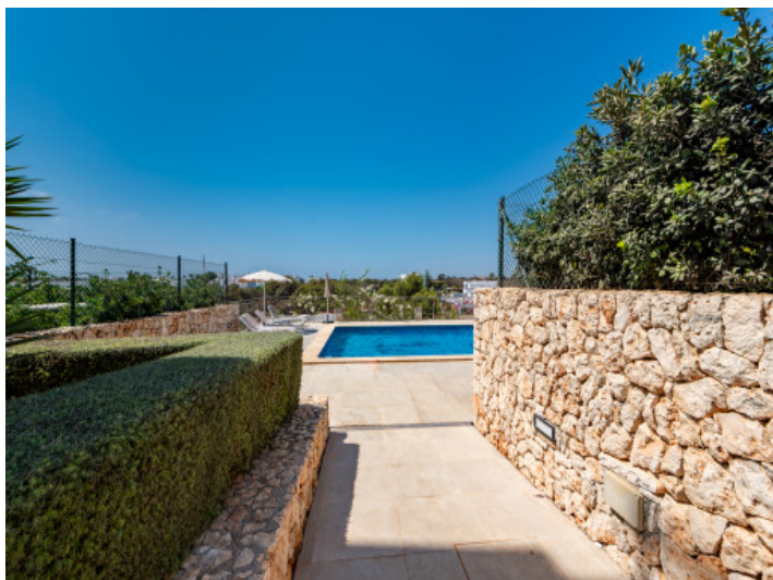
Zugang zum Gemeinschaftspool