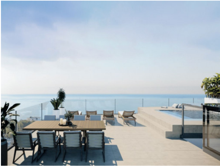
Dachterrasse und Meerblick