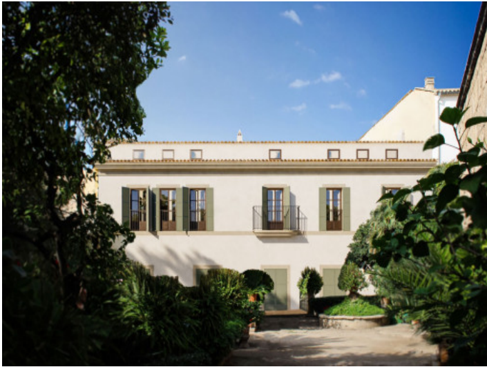
Außenansicht des Gebäudes