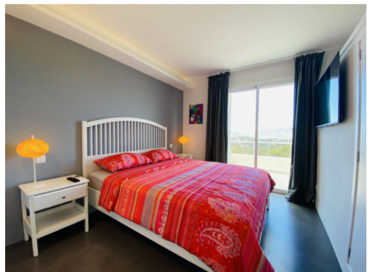
Ein weiteres Schlafzimmer

Alle Angaben nach bestem Wissen. Irrtum und Zwischenverkauf vorbehalten. Dieses Exposé ist eine Vorinformation, als Rechtsgrundlage gilt allein der notariell abgeschlossene Kaufvertrag.