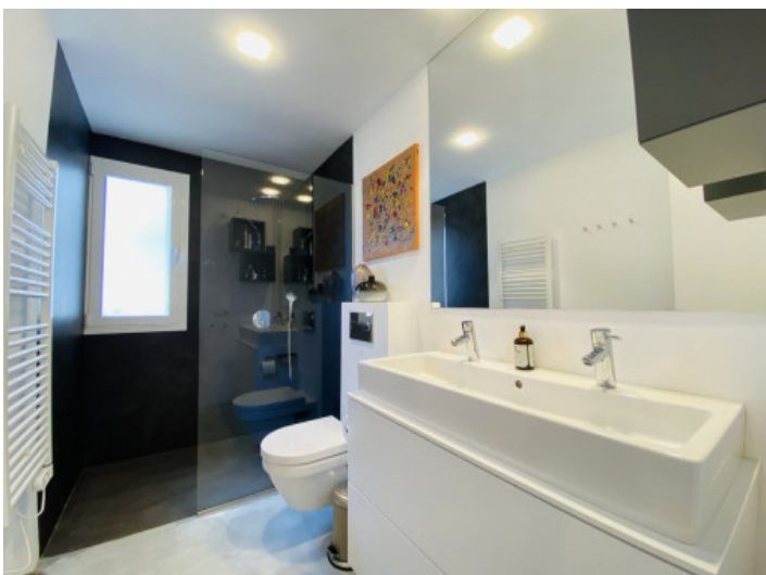
Badezimmern en Suite