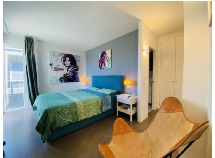
Hauptschlafzimmer mit Badezimmer en Suite