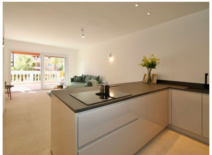
Kücheninsel mit Bora Kochfeld

Alle Angaben nach bestem Wissen. Irrtum und Zwischenverkauf vorbehalten. Dieses Exposé ist eine Vorinformation, als Rechtsgrundlage gilt allein der notariell abgeschlossene Kaufvertrag.