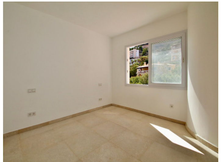
Die Wohnung ist kernsaniert und verfügt über Fußbodenheizung