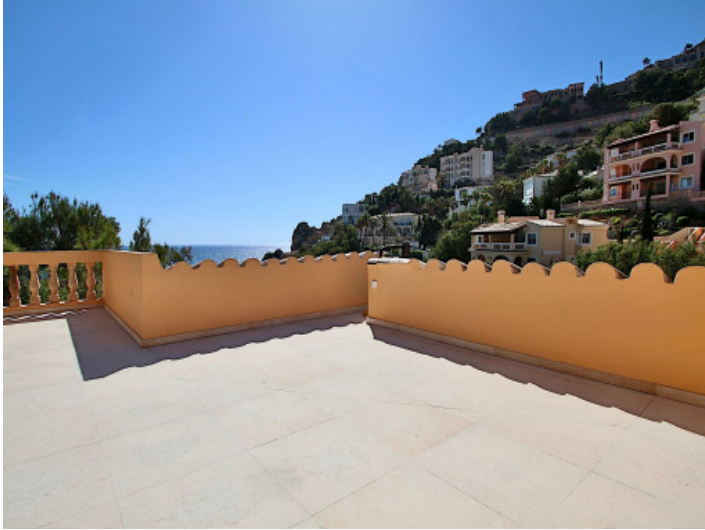
Große Dachterrasse mit Meerblick