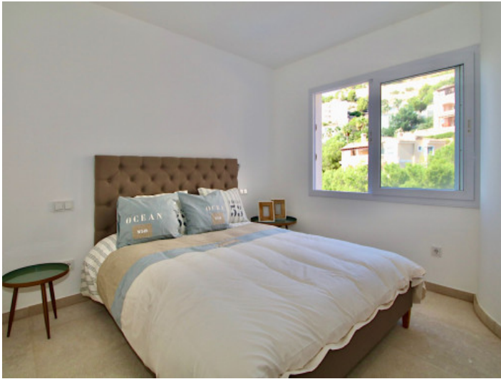
Bequemes Schlafzimmer mit Bad en Suite