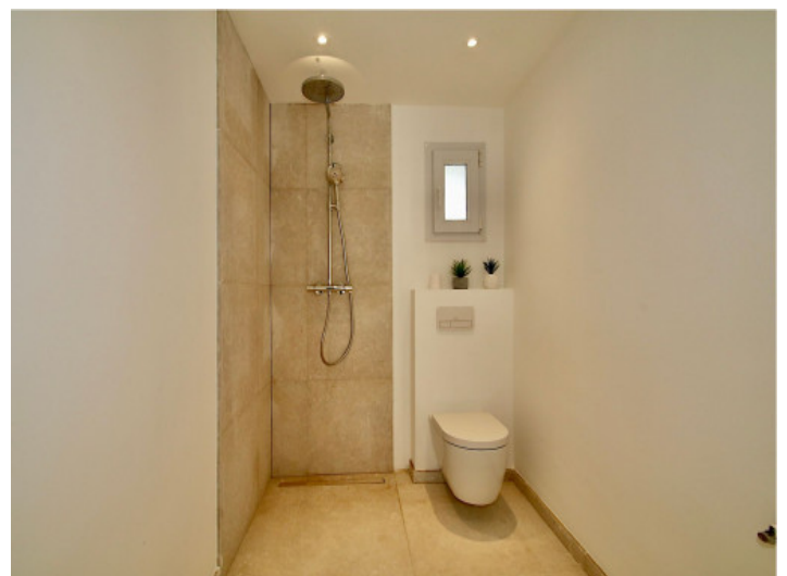
Das 2. Badezimmer

Alle Angaben nach bestem Wissen. Irrtum und Zwischenverkauf vorbehalten. Dieses Exposé ist eine Vorinformation, als Rechtsgrundlage gilt allein der notariell abgeschlossene Kaufvertrag.