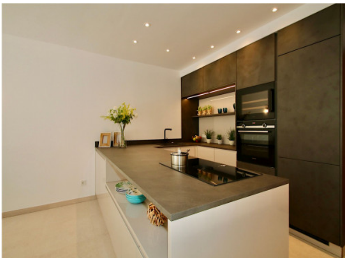
Moderne Küche in einem top renoviertem Apartment