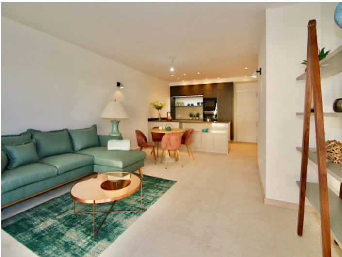
Offener Wohn- und Essbereich mit amerikanischer Küche