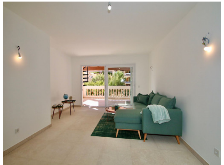
Der Wohnbereich grenzt direkt an die überdachte Terrasse