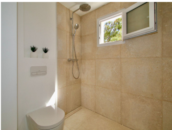
Hansgrohe und Duravit Sanitär