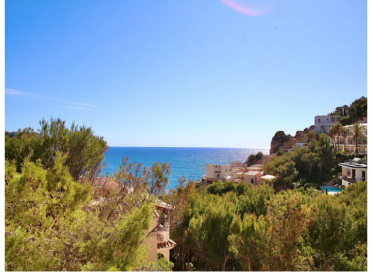
Meerblick und fantastische Sonnenuntergänge