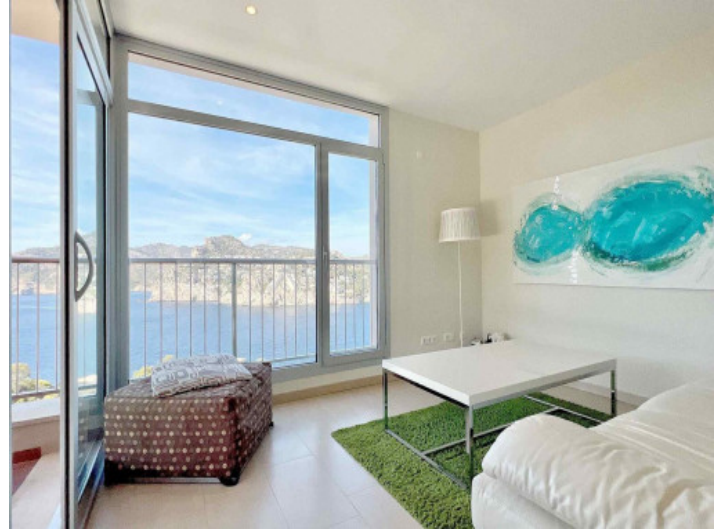
Wohnbereich mit tollem Meerblick