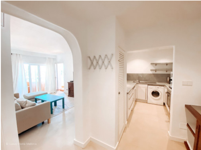
Wohnbereich / Küche