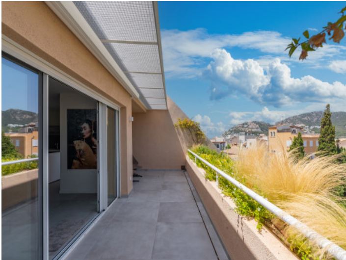
Terrasse mit fantastischem Landschaftsblick