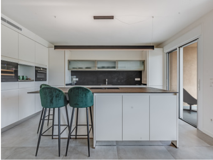
Offene Küche mit Bar