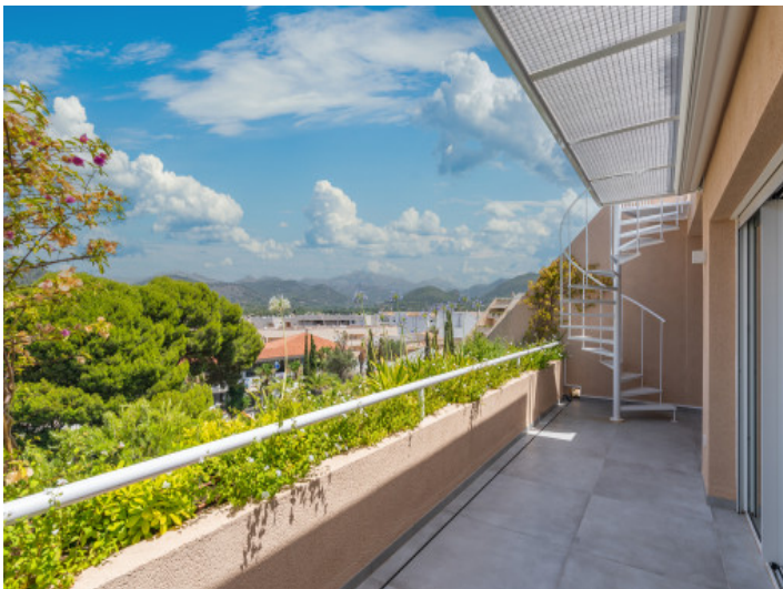
Untere Terrasse mit Zugang zur Dachterrasse