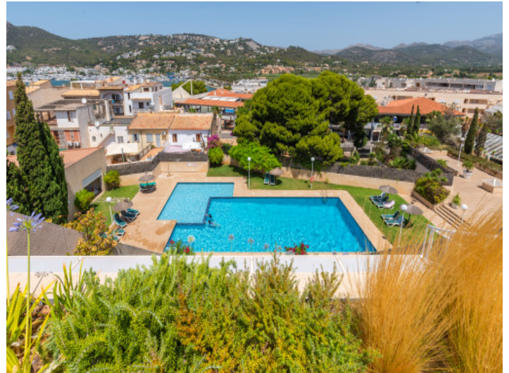
Blick von der Dachterrasse auf den Gemeinschaftspool