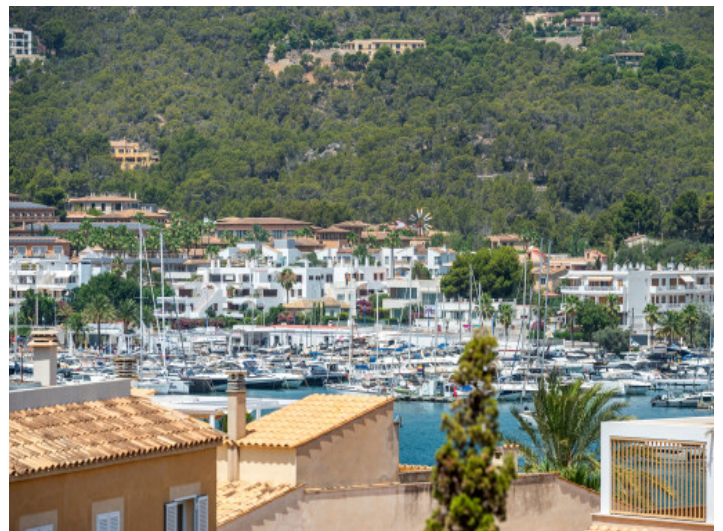
Blick auf den Hafen

Alle Angaben nach bestem Wissen. Irrtum und Zwischenverkauf vorbehalten. Dieses Exposé ist eine Vorinformation, als Rechtsgrundlage gilt allein der notariell abgeschlossene Kaufvertrag.