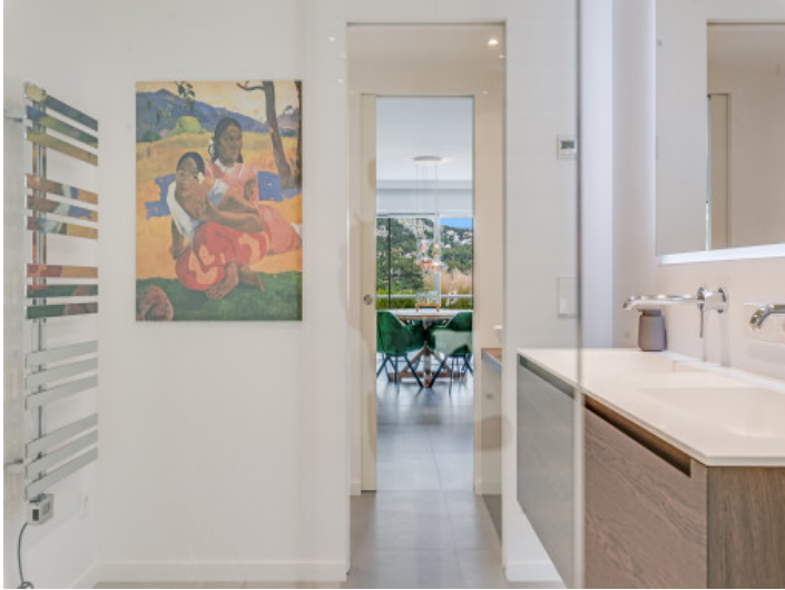
Badezimmer mit Handtuchheizung