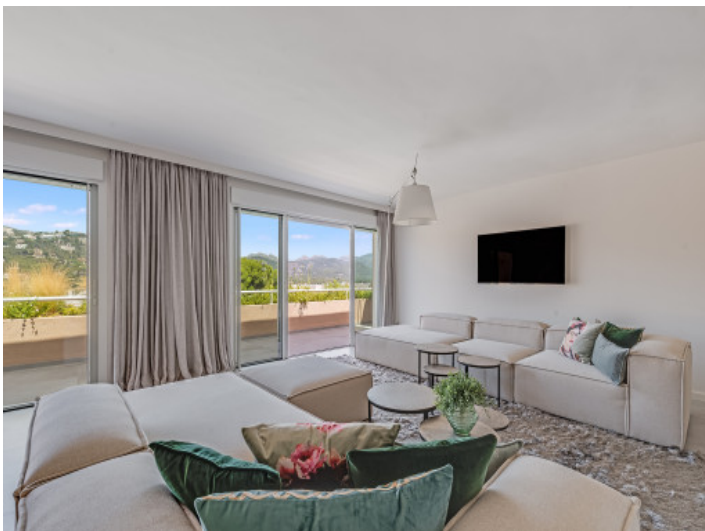
Wohnbereich mit Terrassenzugang