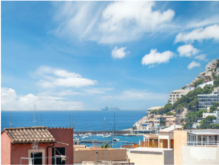
Blick aufs Meer