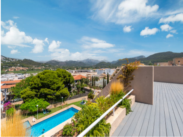
Blick auf den Gemeinschaftspool