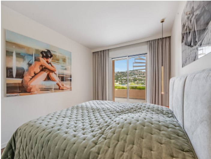
Schlafzimmer mit Terrassenzugang