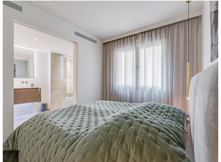
Schlafzimmer mit en Suite Badezimmer