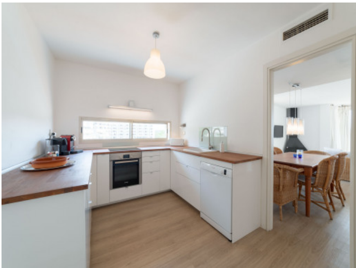
Half-offene, große Küche