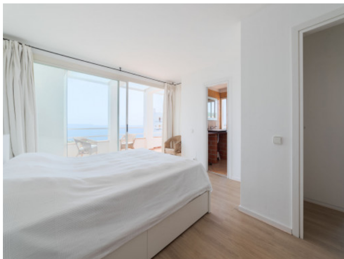
Schlafzimmer mit Meerblick-Terrasse