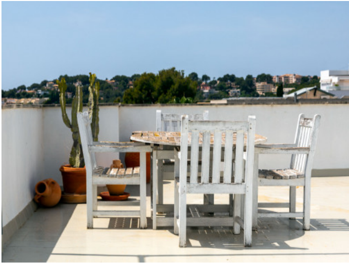
Weitere Terrasse mit Essbereich