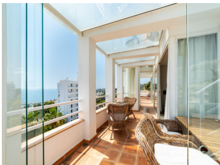
Private Dachterrasse mit Ausblick