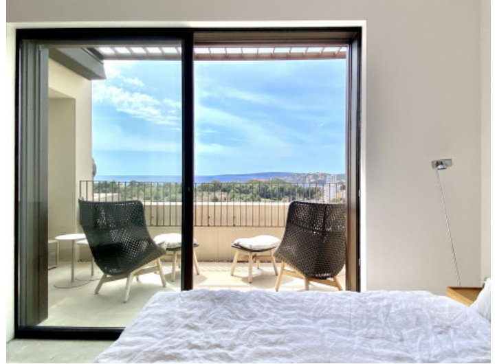
Blick auf den Balkon