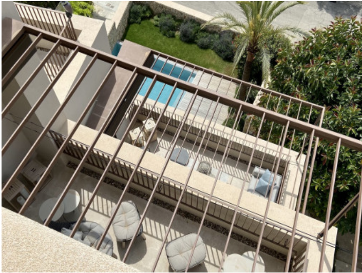
Blick auf den Pool