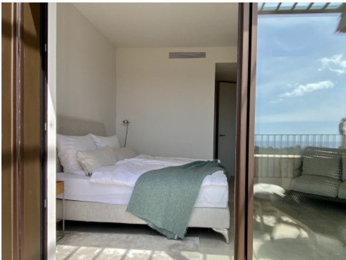
Blick in das Schlafzimmer