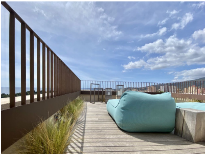
Ansicht der Dachterrasse