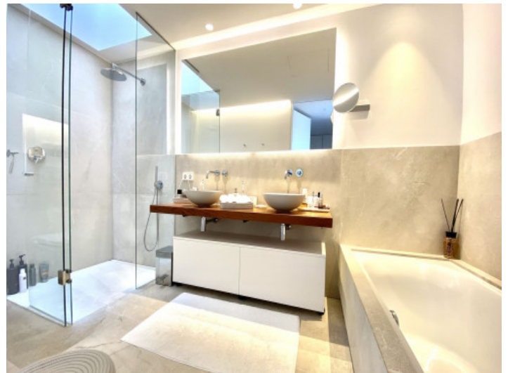
Elegantes Badezimmer mit Dusche