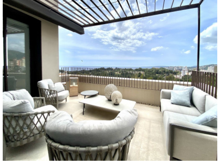
Terrasse mit Chill-Out Lounge