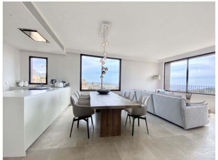
Offener Wohn- und Essbereich