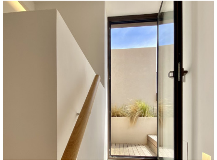
Zugang zur Dachterrasse