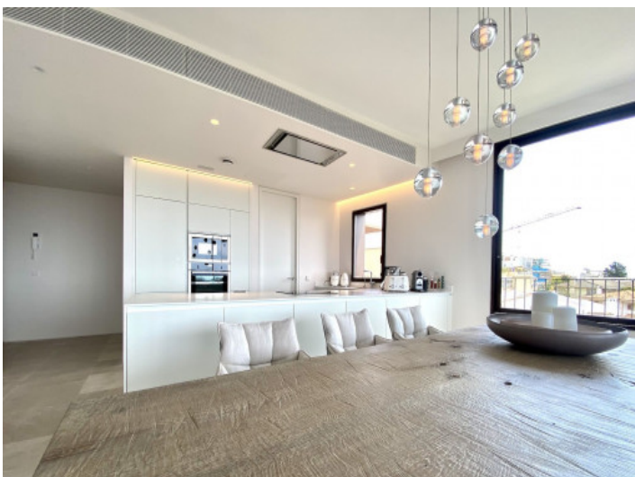
Offener Wohn- und Essbereich