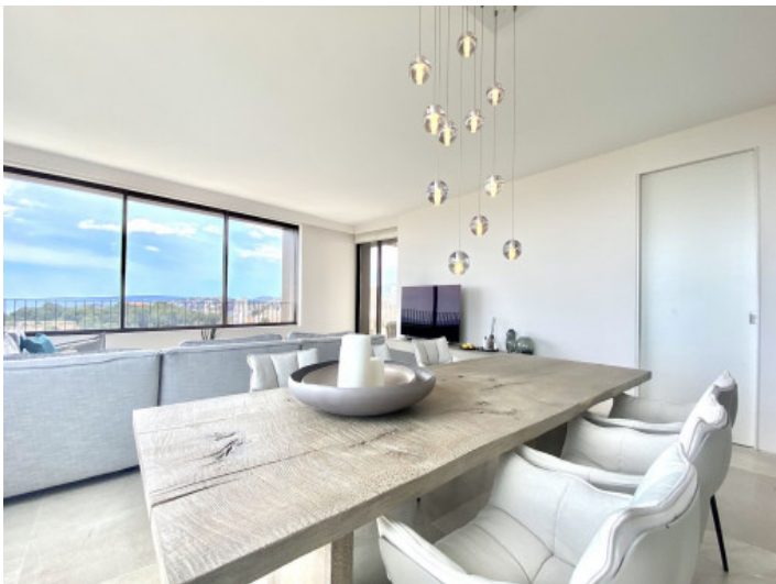
Offener Wohn- und Essbereich