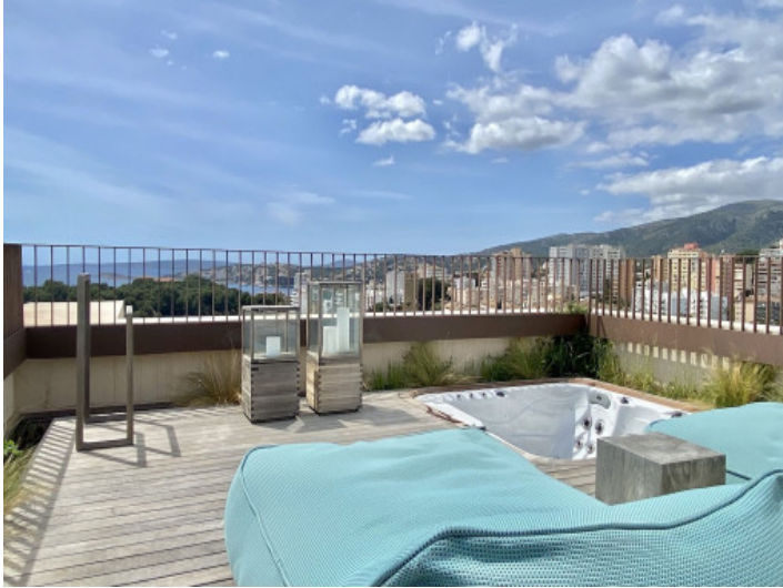
Dachterrasse mit Jacuzzi