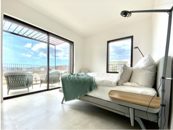
Schlafzimmer mit Balkon