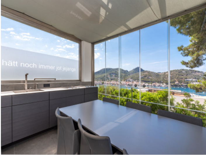
Essbereich mit kleiner Küche