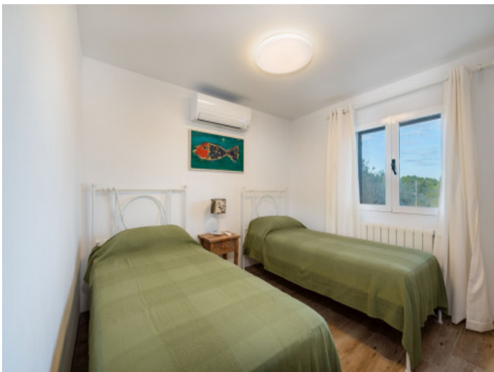
Schlafzimmer 1. Etage