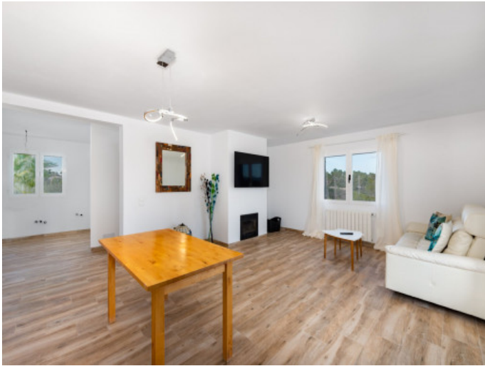
Wohnbereich Oben mit Kamin