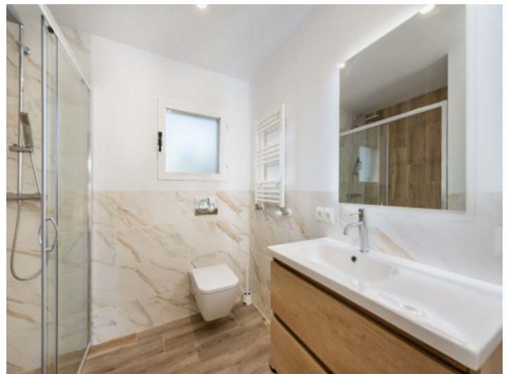
Villa mit 2 Badezimmern

Alle Angaben nach bestem Wissen. Irrtum und Zwischenverkauf vorbehalten. Dieses Exposé ist eine Vorinformation, als Rechtsgrundlage gilt allein der notariell abgeschlossene Kaufvertrag.