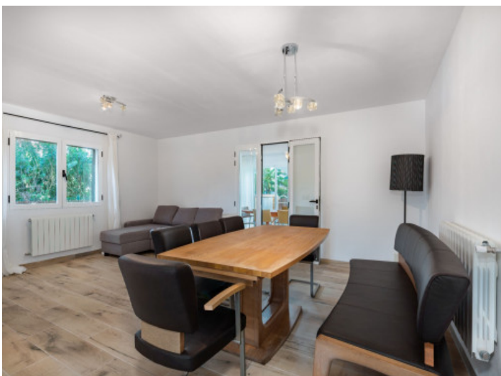
Wohn- und Essbereich EG