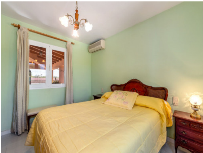
Eines von 4 Schlafzimmern