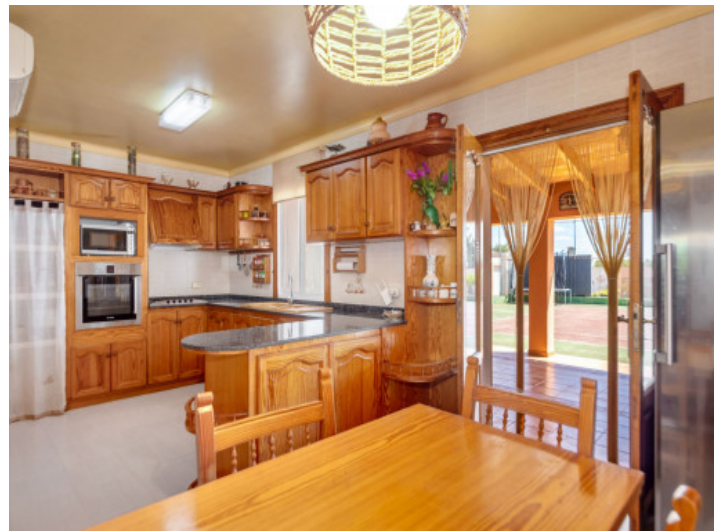
Küche im Landhausstil