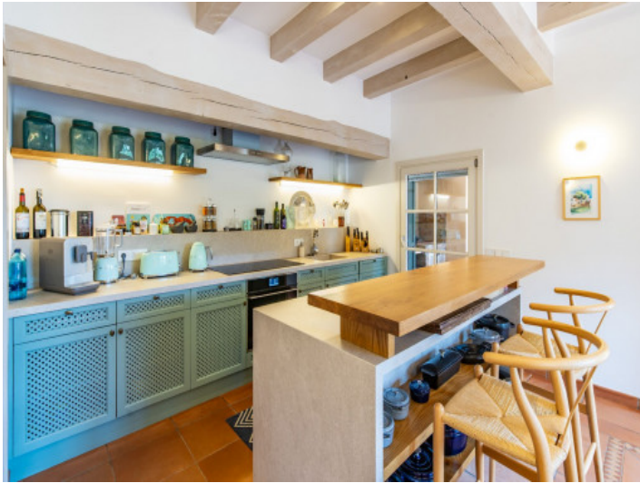
Küche im Landhausstil