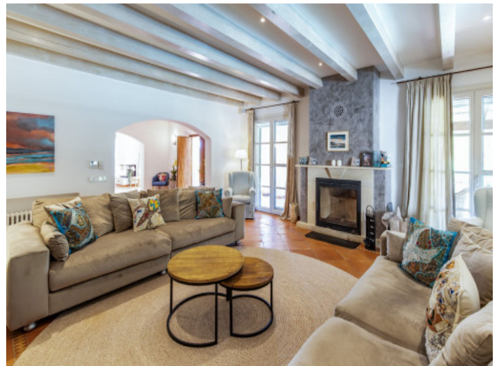
Gemütlicher Wohnbereich mit Kamin