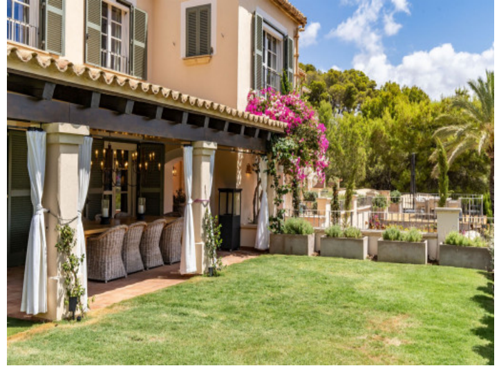
Villa in Toplage