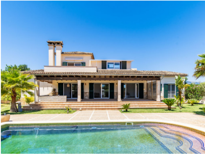
Sehr gepflegter Pool und Garten