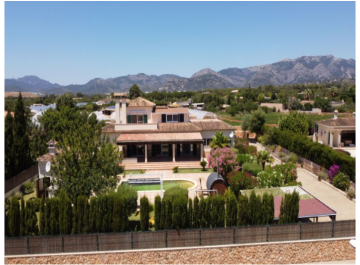
Ansicht auf dieses schöne Einfamilienhaus