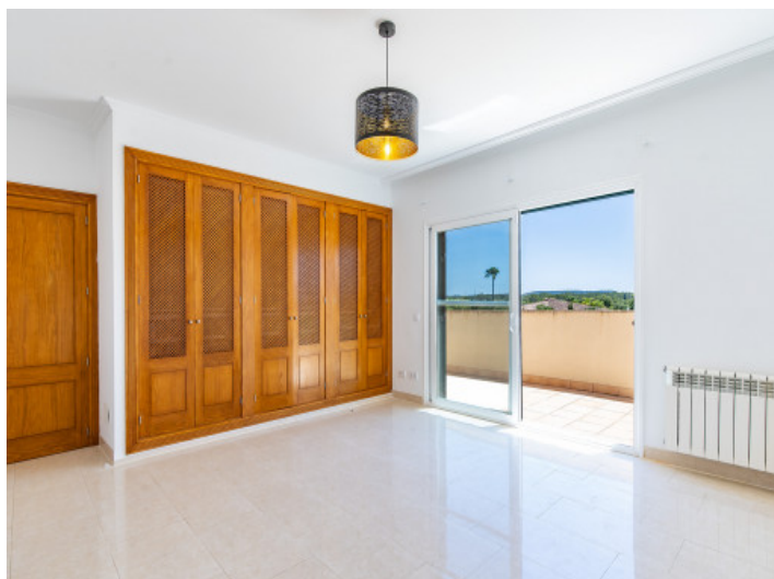
Eines von 5 Schlafzimmern