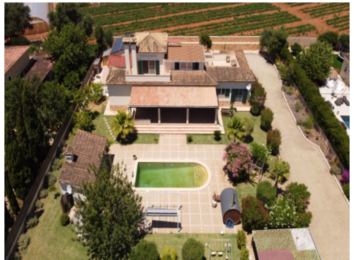
Ansicht auf die Villa