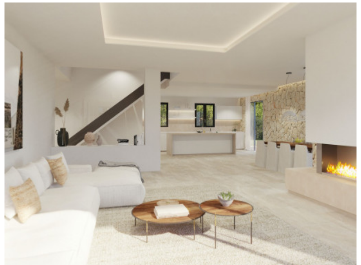
Lichtdurchfluteter Wohnbereich mit Kamin