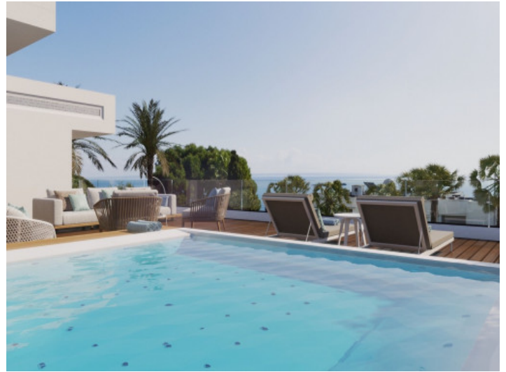
Pool mit Weitblick