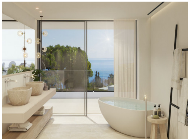
Badezimmer mit Badewanne

Alle Angaben nach bestem Wissen. Irrtum und Zwischenverkauf vorbehalten. Dieses Exposé ist eine Vorinformation, als Rechtsgrundlage gilt allein der notariell abgeschlossene Kaufvertrag.