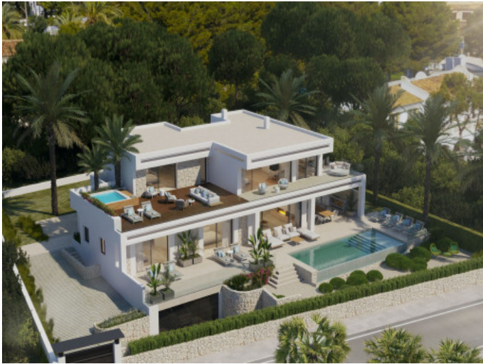
Außenansicht der eleganten Villa mit Pool