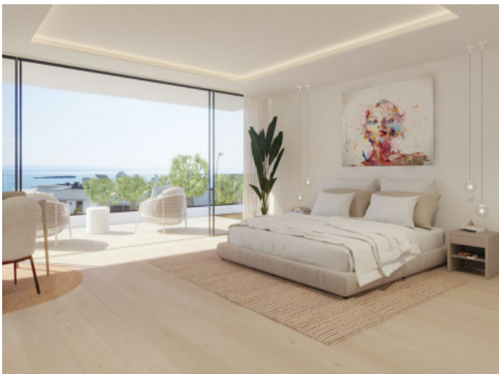
Hauptschlafzimmer mit Badezimmer en Suite