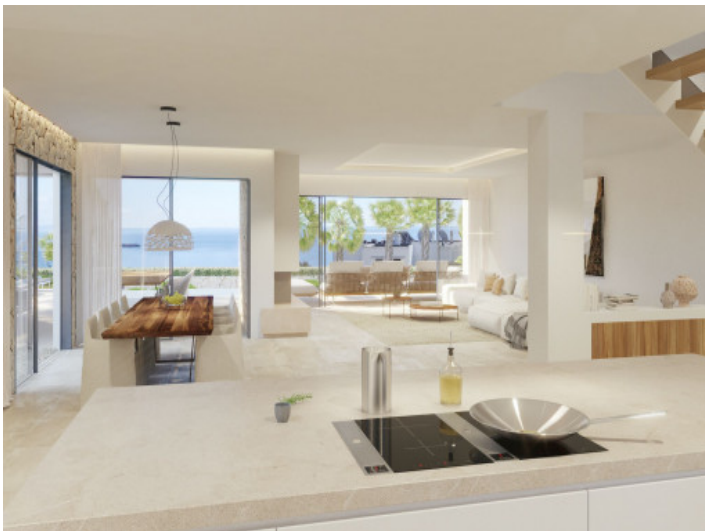
Offener Wohnbereich und Küche