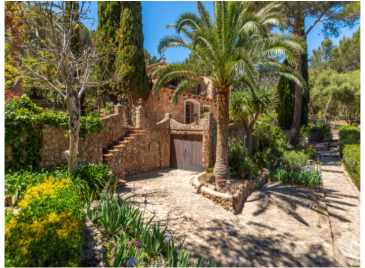
Gewachsener mediterraner Garten