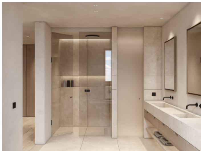
Moderne Badezimmer mit Bedientiefer Dusche

Alle Angaben nach bestem Wissen. Irrtum und Zwischenverkauf vorbehalten. Dieses Exposé ist eine Vorinformation, als Rechtsgrundlage gilt allein der notariell abgeschlossene Kaufvertrag.