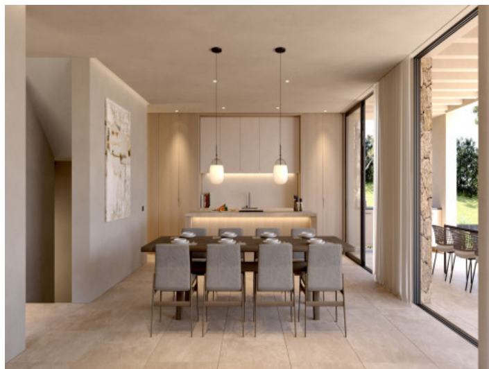
Moderne Küche mit Essbereich