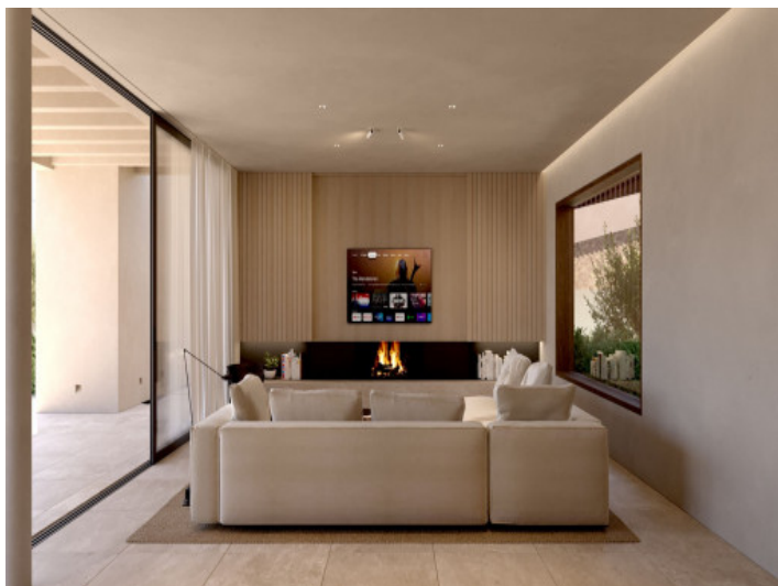
Gemütlicher Wohnbereich mit Kamin