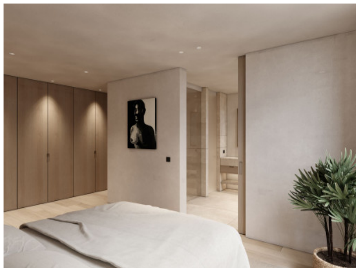
Schlafzimmer mit Bad en Suite