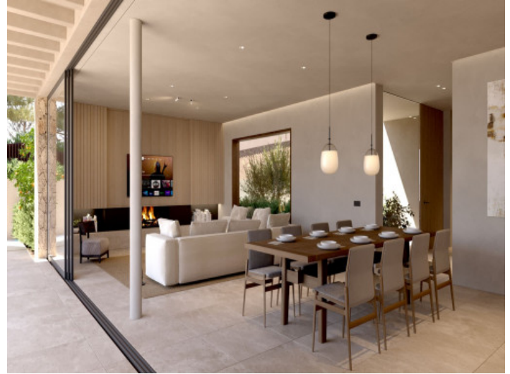
Wohn und Essbereich