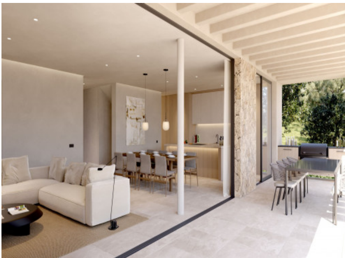
Innen und Aussenbereich gehen nahtlos ineinander über