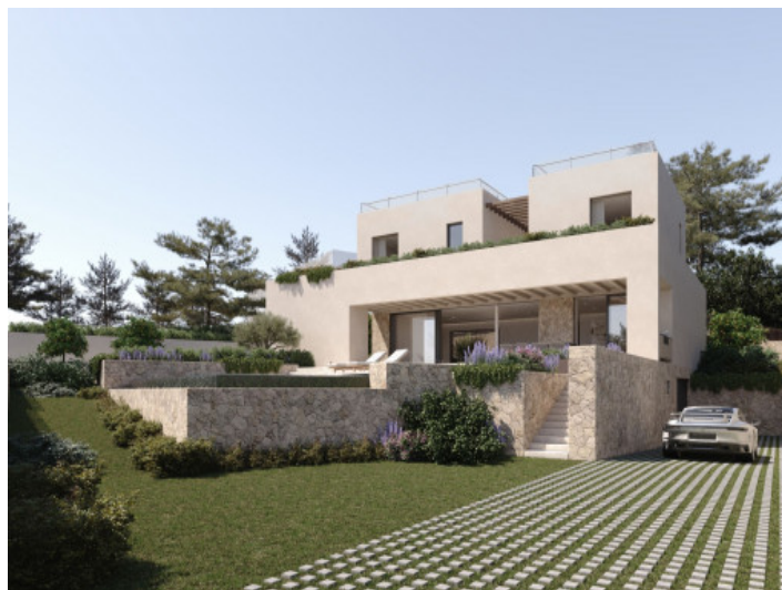
Ansicht auf die Fassade