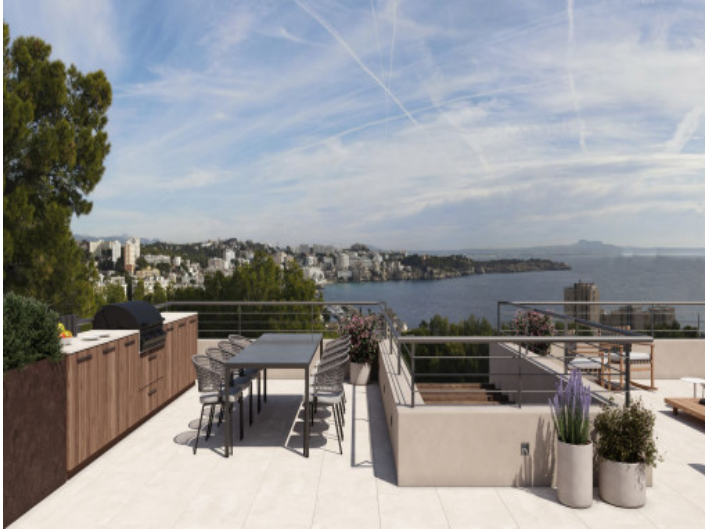
Komfortable Dachterrasse mit Aussenküche