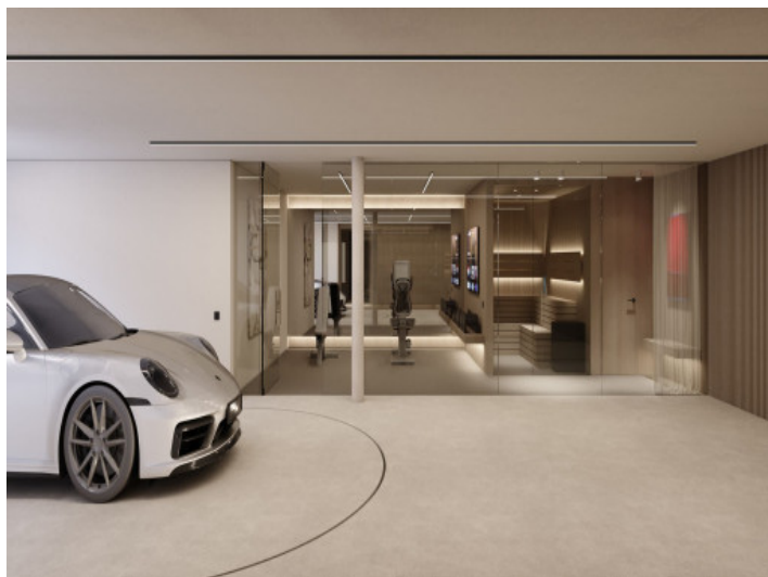
Fitnessraum und Sauna