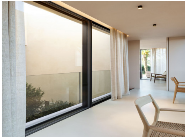
Große Fensterfronten sorgen für helle Wohnräume