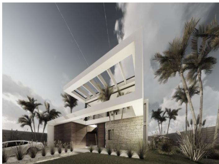
Eingangsbereich und Garten

Alle Angaben nach bestem Wissen. Irrtum und Zwischenverkauf vorbehalten. Dieses Exposé ist eine Vorinformation, als Rechtsgrundlage gilt allein der notariell abgeschlossene Kaufvertrag.