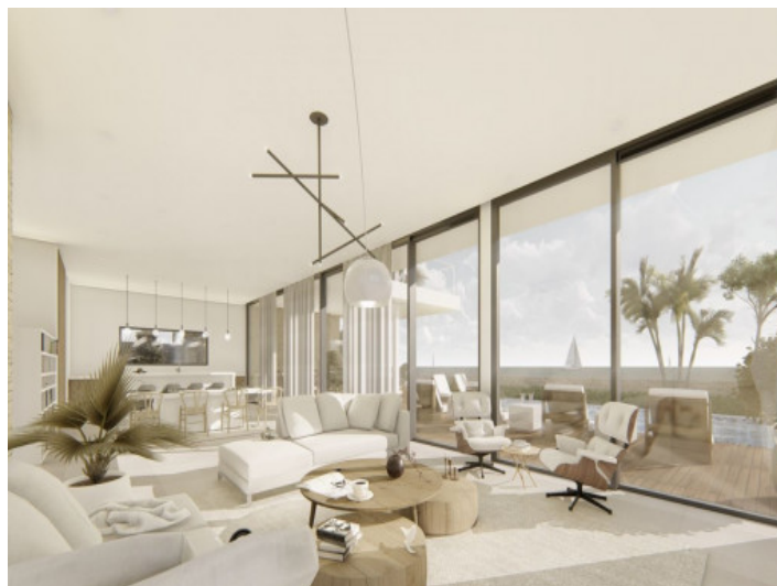
Wohnbereich mit Meerblick