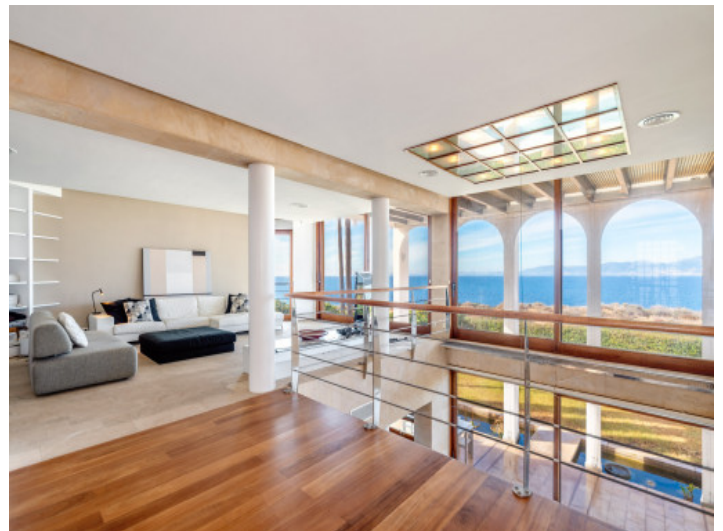
Offene Galerie im Obergeschoss