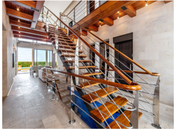
Treppe führt in die oberen Etagen