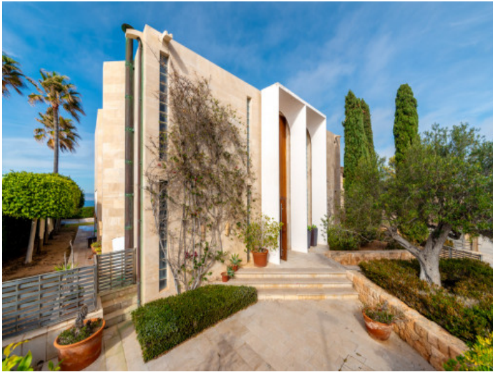
Frontansicht der Villa