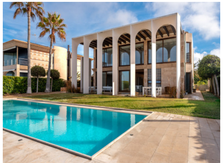
Blick vom Pool auf die Villa

Alle Angaben nach bestem Wissen. Irrtum und Zwischenverkauf vorbehalten. Dieses Exposé ist eine Vorinformation, als Rechtsgrundlage gilt allein der notariell abgeschlossene Kaufvertrag.