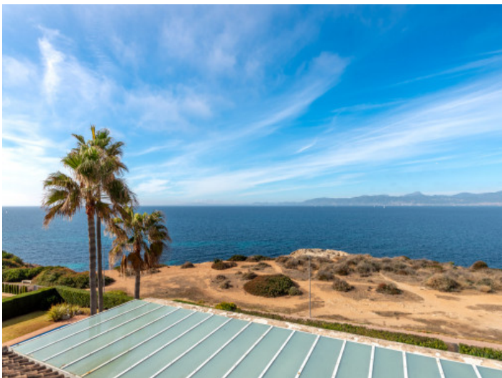
Blick auf das Mittelmeer vom Obergeschoss aus