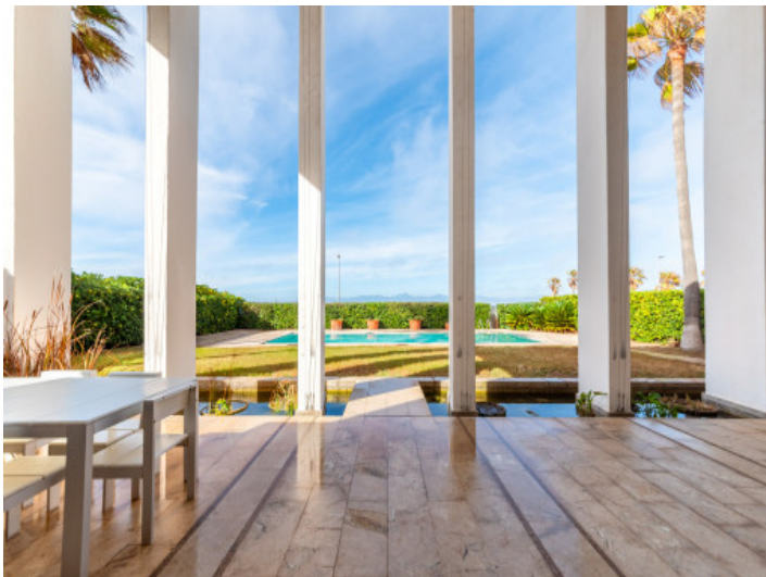
Überdachte Terrasse mit Gartenblick