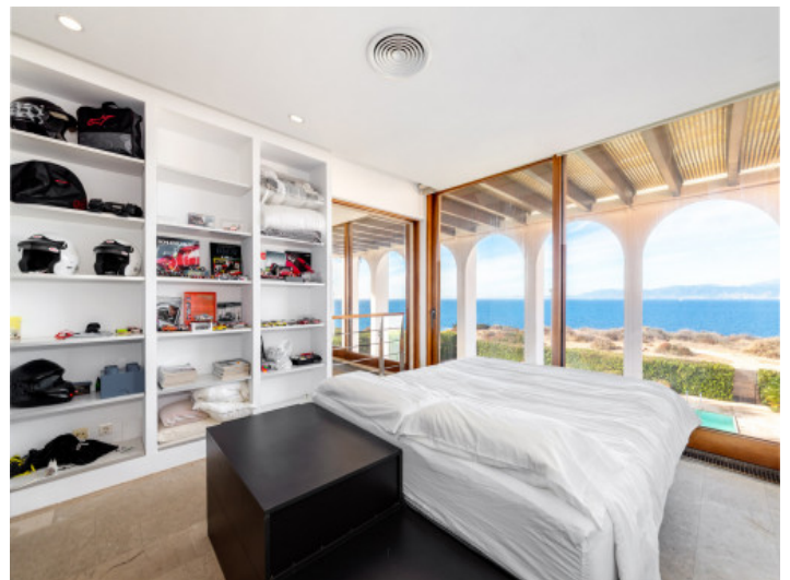
Gemütliches Schlafzimmer mit Meerblick

Alle Angaben nach bestem Wissen. Irrtum und Zwischenverkauf vorbehalten. Dieses Exposé ist eine Vorinformation, als Rechtsgrundlage gilt allein der notariell abgeschlossene Kaufvertrag.