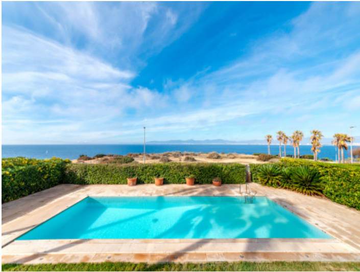
Fantastischer Pool mit Meerblick