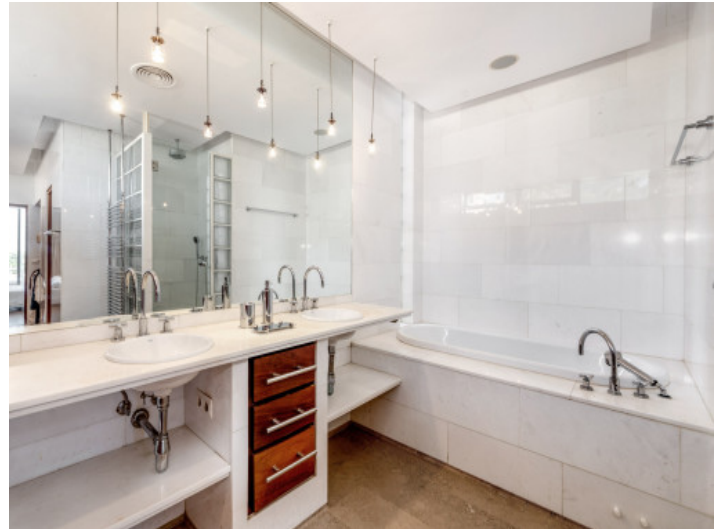
Badezimmer mit Badewanne