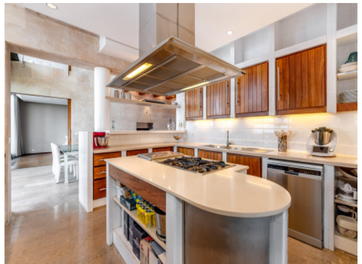
Küche mit Kochinsel

Alle Angaben nach bestem Wissen. Irrtum und Zwischenverkauf vorbehalten. Dieses Exposé ist eine Vorinformation, als Rechtsgrundlage gilt allein der notariell abgeschlossene Kaufvertrag.