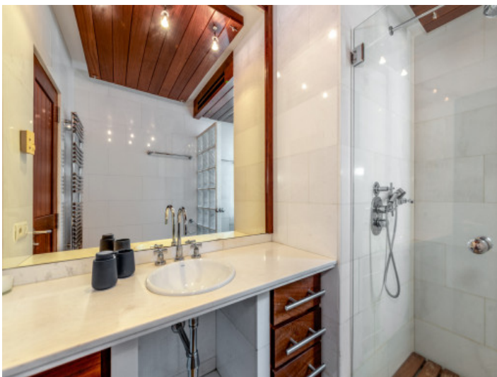
Eines von 3 Badezimmern