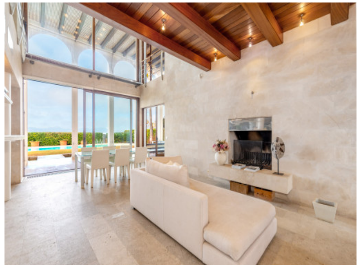
Entrée der Villa mit Loungebereich