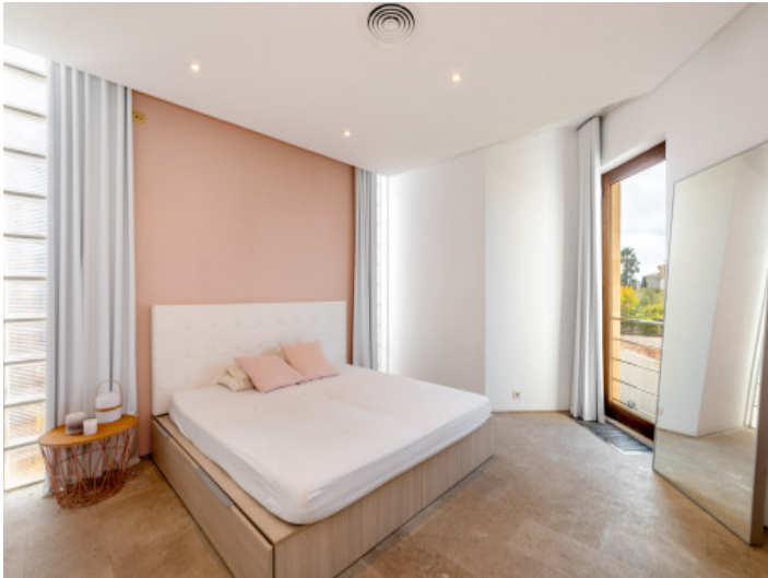
Eines von 5 Schlafzimmern