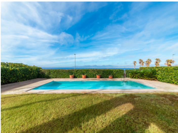
Gepflegter Garten mit Meerblick