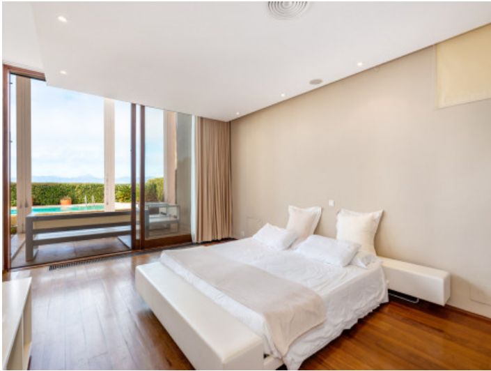
Schlafzimmer mit Gartenzugang