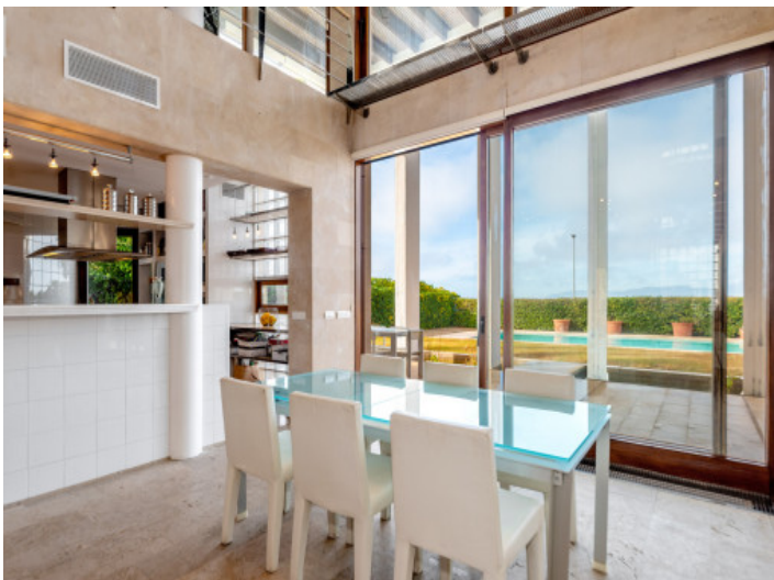
Offene Küche und Essbereich