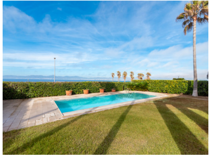
Poolbereich in erster Meereslinie