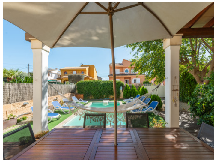
Terrasse mit Essbereich