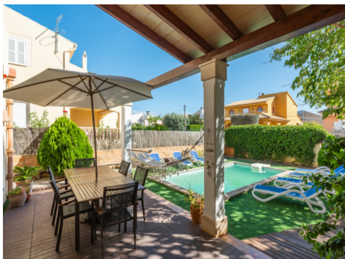
Terrasse mit Blick auf den Pool