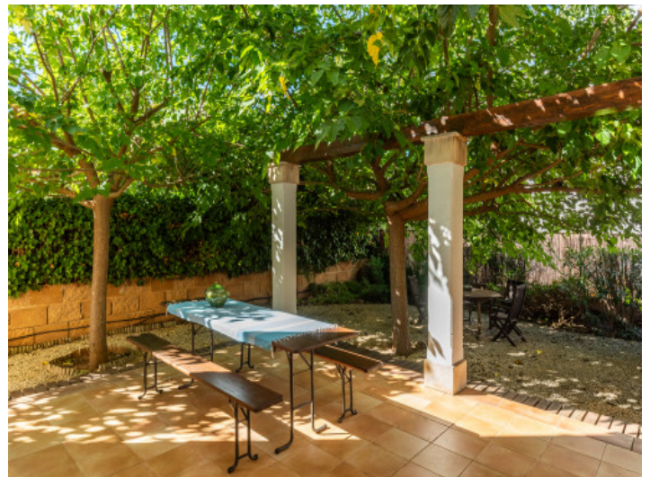
Hintere Terrasse der Villa