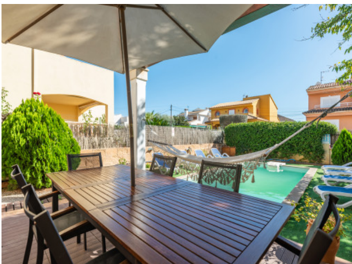
Terrasse der Villa