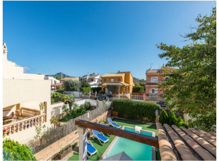
Blick über den Poolbereich