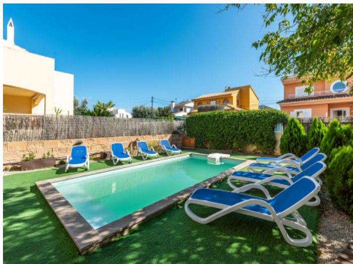
Poolbereich der Villa