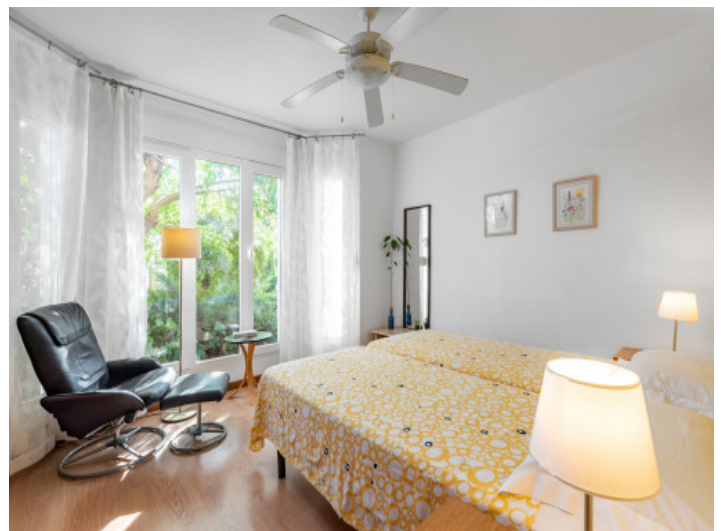
Schlafzimmer mit Ventilator