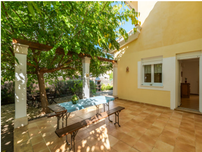
Terrasse mit schattenspendenden Bäumen