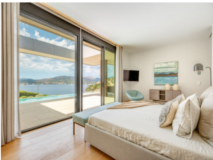
Schlafzimmer mit Meerblick-Terrasse