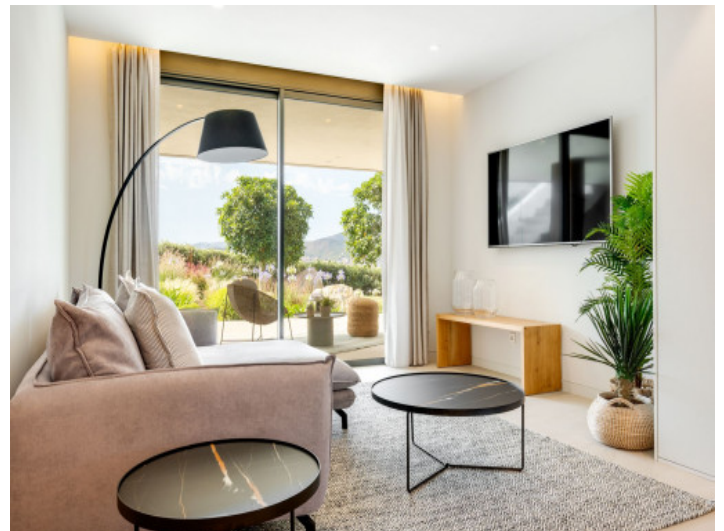
Wohnbereich im untrgeschoss