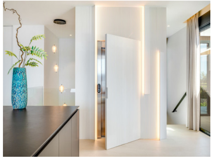
Ein Aufzug verbindet die Stockwerke