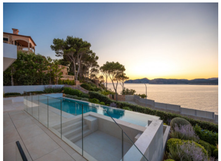
Herrlicher Meerblick von der Terrasse

Alle Angaben nach bestem Wissen. Irrtum und Zwischenverkauf vorbehalten. Dieses Exposé ist eine Vorinformation, als Rechtsgrundlage gilt allein der notariell abgeschlossene Kaufvertrag.