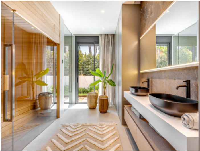
Luxusbadezimmer mit Dusche