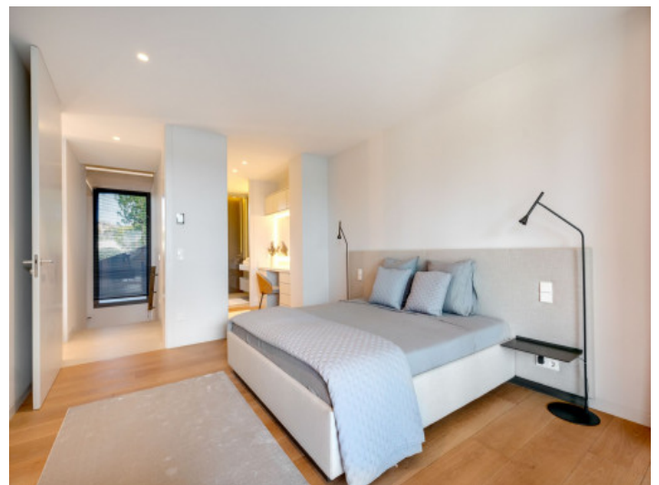
Offenes en Suite Badezimmer