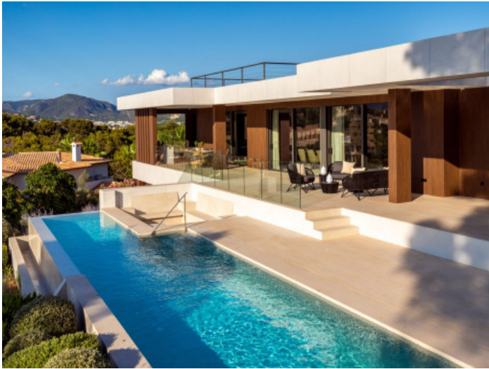
Eleganter Pool mit Sonnenterrasse