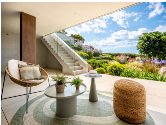
Entspannter Loungebereich auf der unteren Terrasse