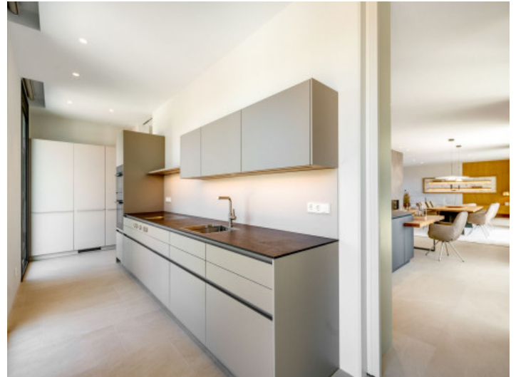
Weitere versteckte Küche