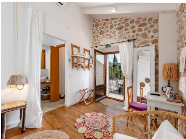
Schlafzimmer mit viel Charme