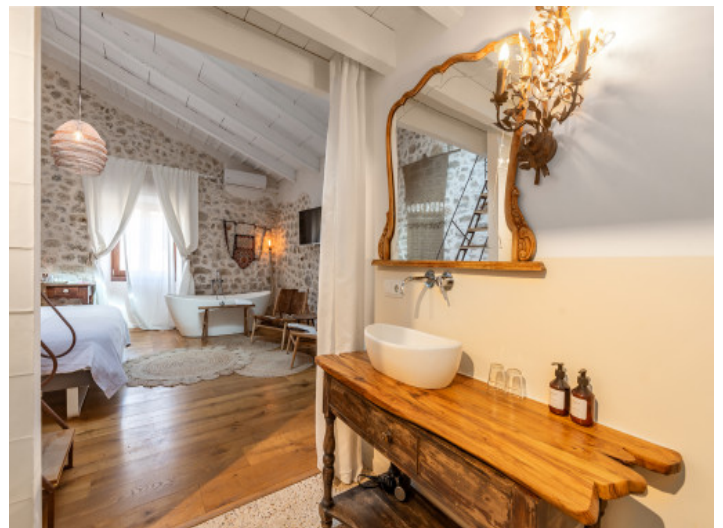
Fantastisches en Suite Badezimmer

Alle Angaben nach bestem Wissen. Irrtum und Zwischenverkauf vorbehalten. Dieses Exposé ist eine Vorinformation, als Rechtsgrundlage gilt allein der notariell abgeschlossene Kaufvertrag.