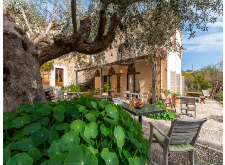
Perfekter Platz für einen Drink