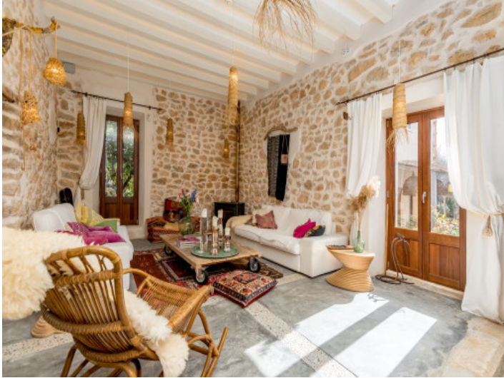
Gemütlicher Wohnbereich mit Terrassenzugang