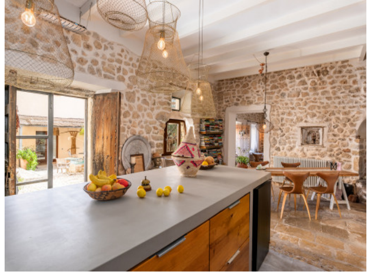
Offener Küchenbereich mit Terrassenzugang