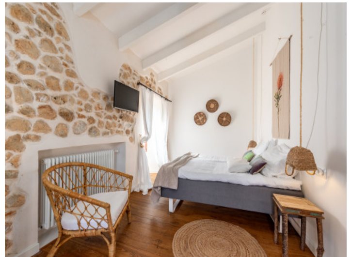
Eines von 8 Schlafzimmern