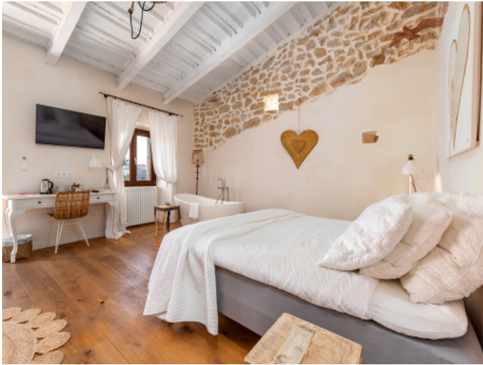
Eines von 8 Schlafzimmern