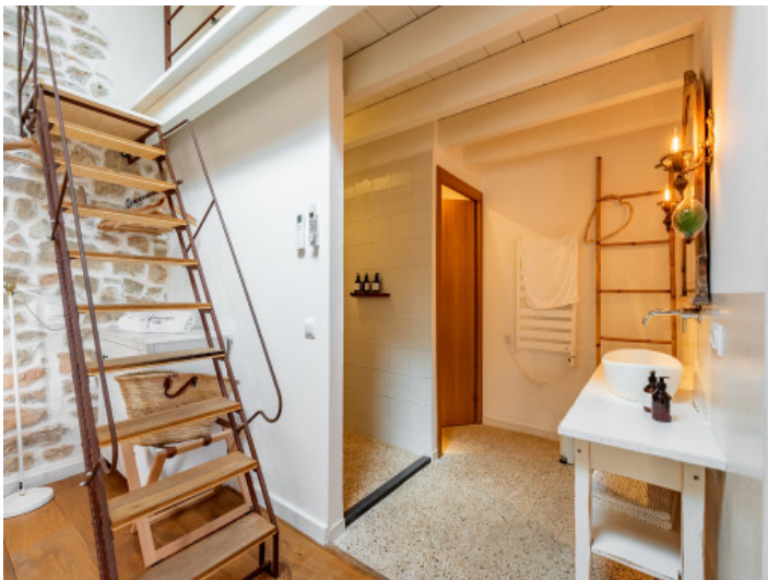
Offenes, modernes Badezimmer