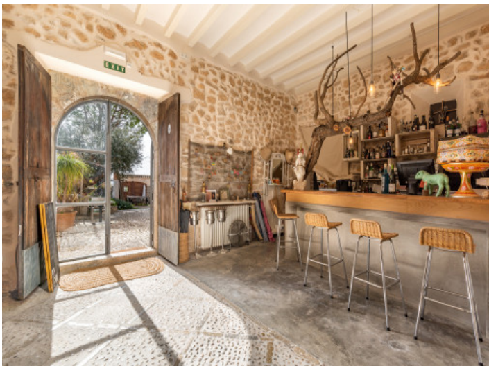
Eingang zum Haupthaus mit Barbereich