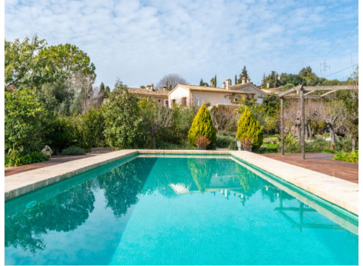
Schön gelegener Salzwasserpool