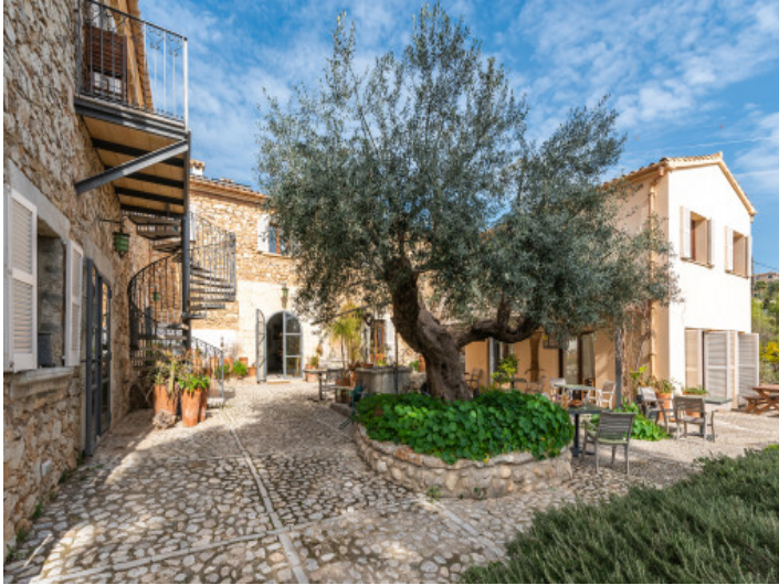
Fincaansicht und bezaubernde patio-ähnliche Terrasse