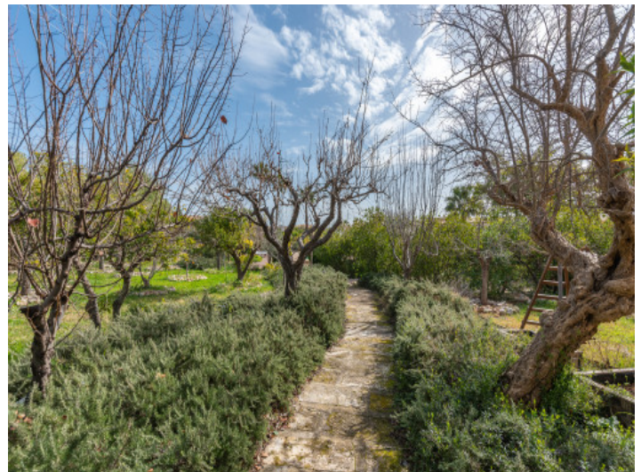
Pfad durch den Garten mit Obstbäumen