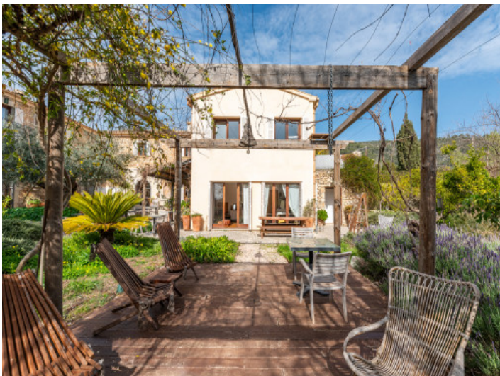
Weitere Terrasse im Garten