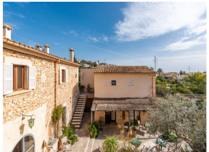
Blick über die herrliche Terrasse

Alle Angaben nach bestem Wissen. Irrtum und Zwischenverkauf vorbehalten. Dieses Exposé ist eine Vorinformation, als Rechtsgrundlage gilt allein der notariell abgeschlossene Kaufvertrag.