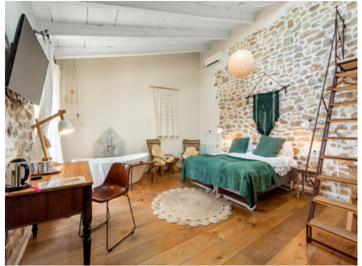
Schlafzimmer mit einzigartigem Charakter