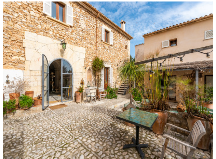
Außenansicht der Finca und Eingang