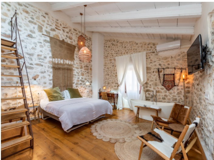
Individuell eingerichtetes Schlafzimmer