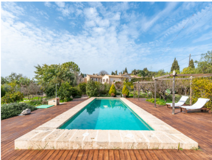
Großer 12 x 4 m Pool und Sonnenterrassen