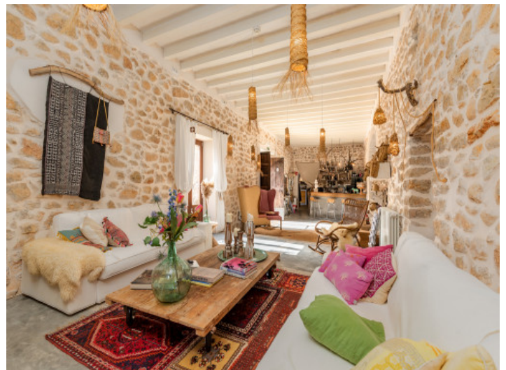
Großer, offener Wohnbereich

Alle Angaben nach bestem Wissen. Irrtum und Zwischenverkauf vorbehalten. Dieses Exposé ist eine Vorinformation, als Rechtsgrundlage gilt allein der notariell abgeschlossene Kaufvertrag.