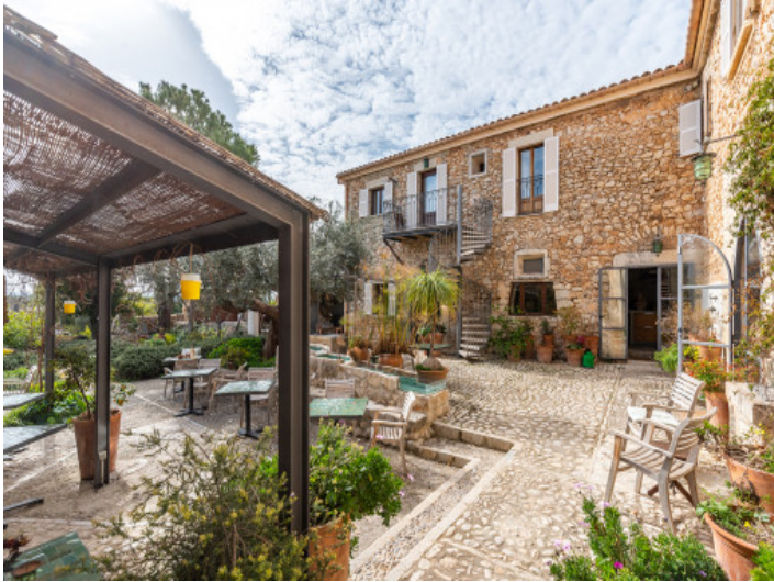
Wundervolle vordere Terrasse