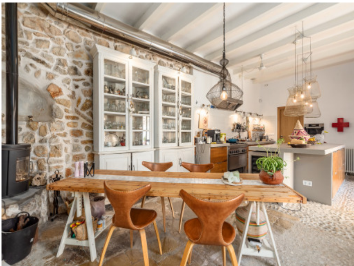
Estisch mit Kamin und viel Charakter