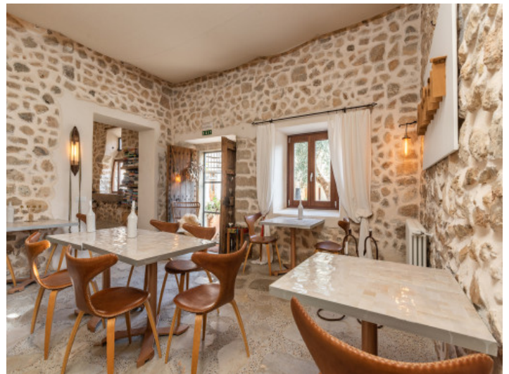
Separator, großer Essraum