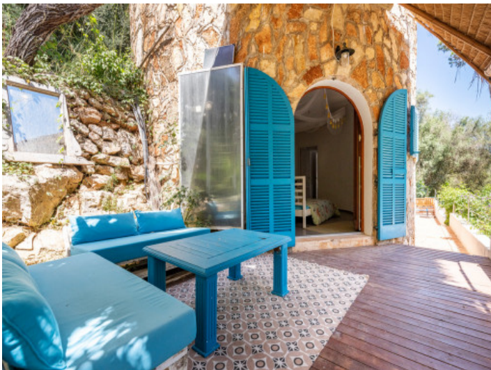
Überdachte, hintere Terrasse