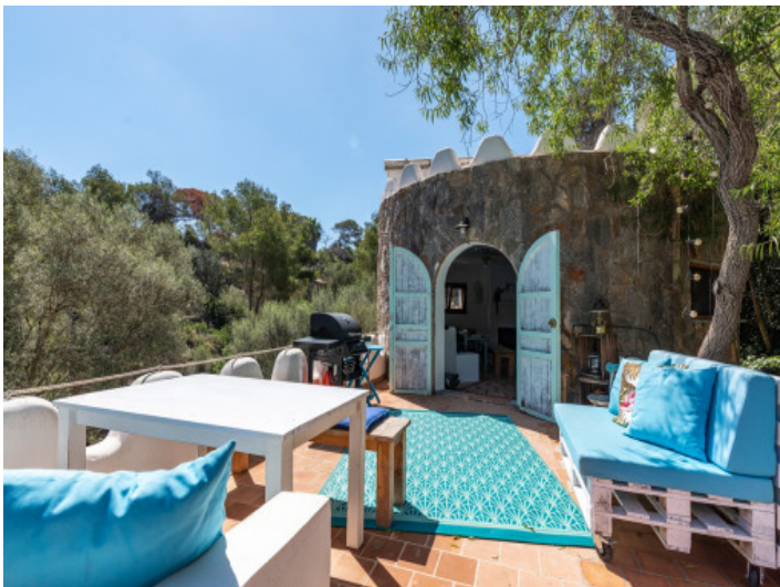
Sitzecke auf der Terrasse