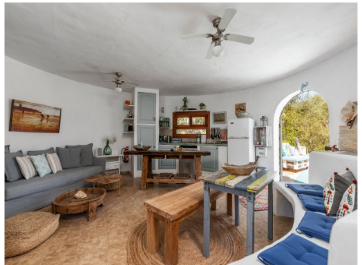
Offener Wohn- und Essbereich mit Küche