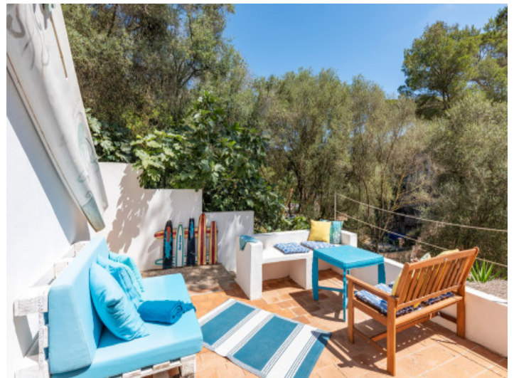
Alternative Ansicht der Terrasse