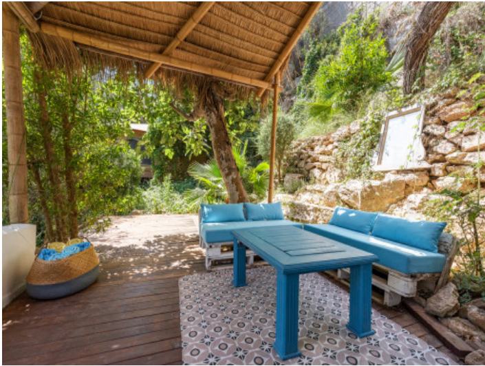
Sitzbereich auf der hinteren Terrasse