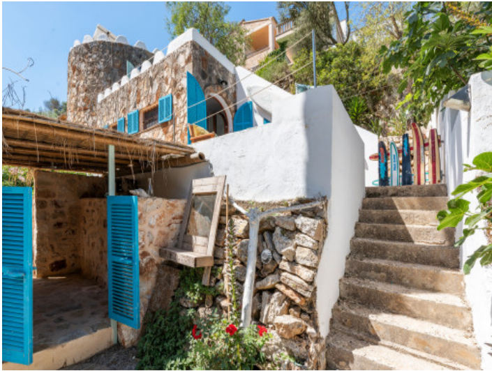
Zugang zum Haus