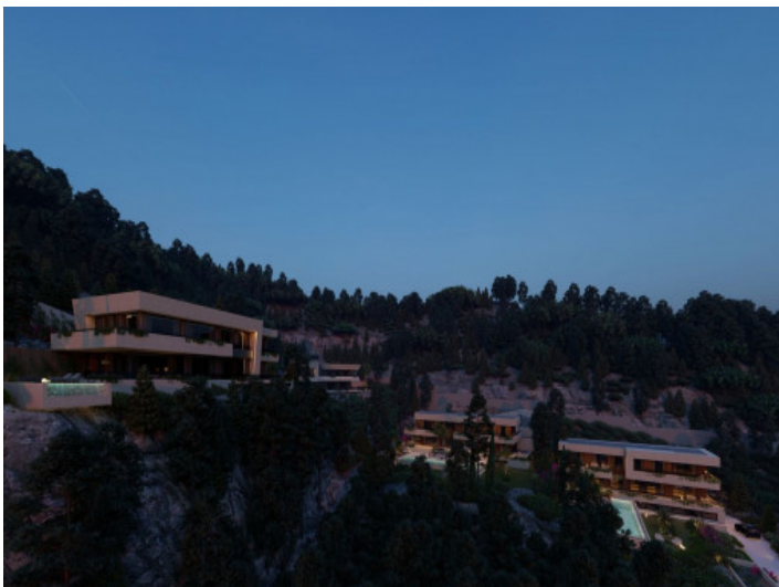
Blick von oben