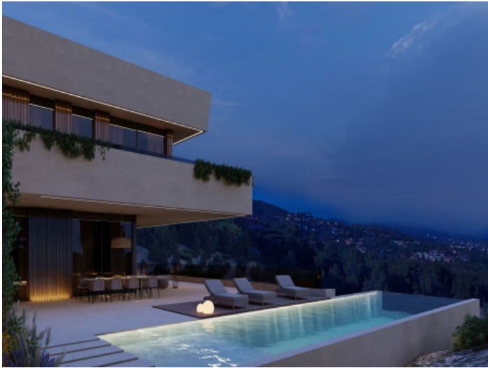
Poolbereich bei Nacht