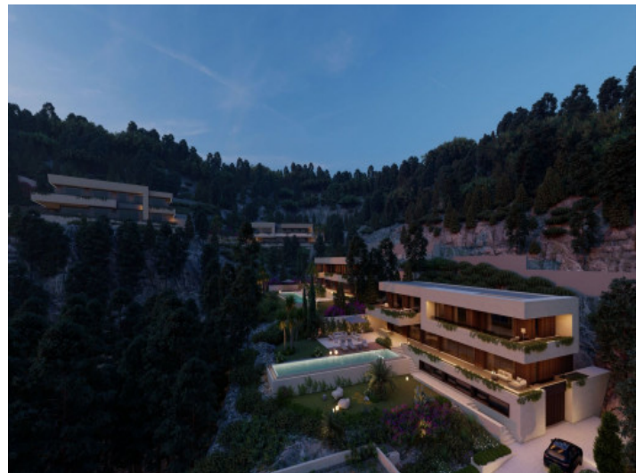
Blick von oben