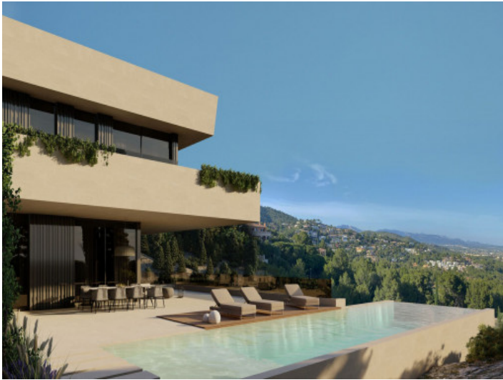
Außenansicht und Poolbereich