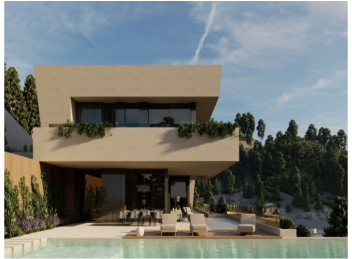
Außenansicht und Poolbereich