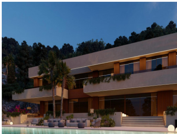
Außenansicht bei Nacht