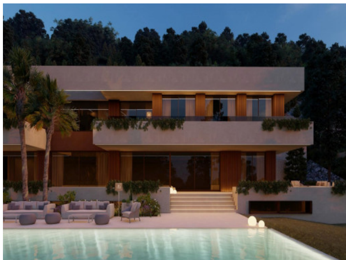
Außenansicht bei Nacht