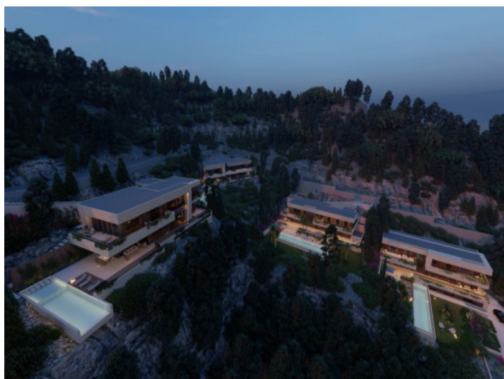
Blick von oben