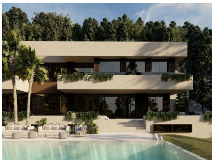
Außenansicht bei Tag