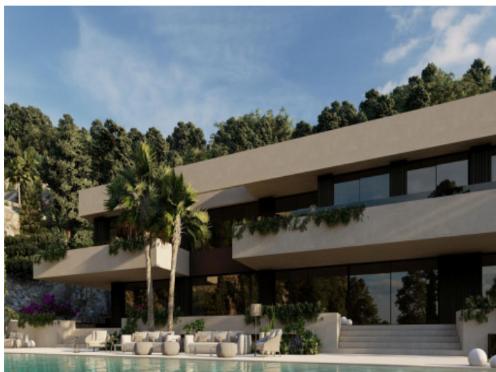
Außenansicht bei Tag