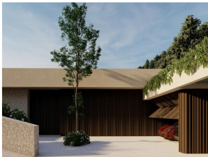
Zufahrt / Garage

Alle Angaben nach bestem Wissen. Irrtum und Zwischenverkauf vorbehalten. Dieses Exposé ist eine Vorinformation, als Rechtsgrundlage gilt allein der notariell abgeschlossene Kaufvertrag.