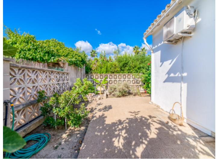
Terrasse und kleiner Garten