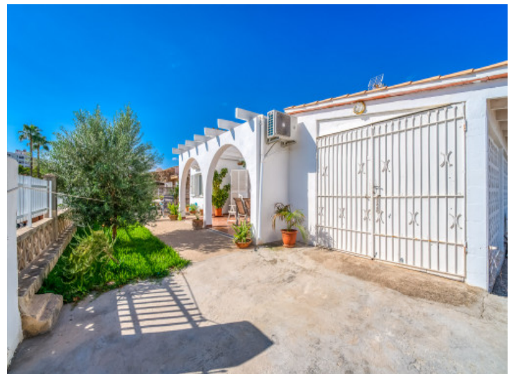
Zufahrt zur Garage

Alle Angaben nach bestem Wissen. Irrtum und Zwischenverkauf vorbehalten. Dieses Exposé ist eine Vorinformation, als Rechtsgrundlage gilt allein der notariell abgeschlossene Kaufvertrag.