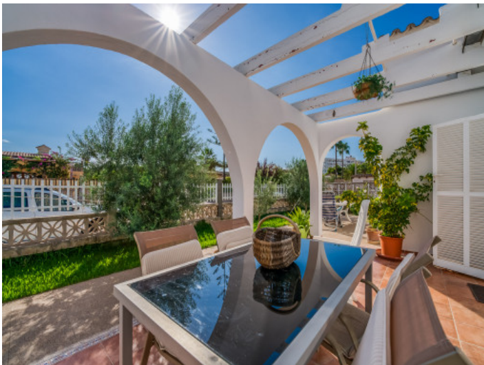
Frontterrasse mit Essbereich