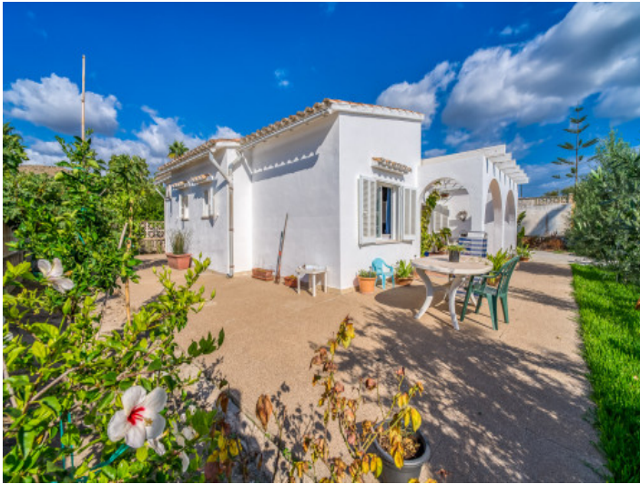
Große Terrassen umgeben das Haus