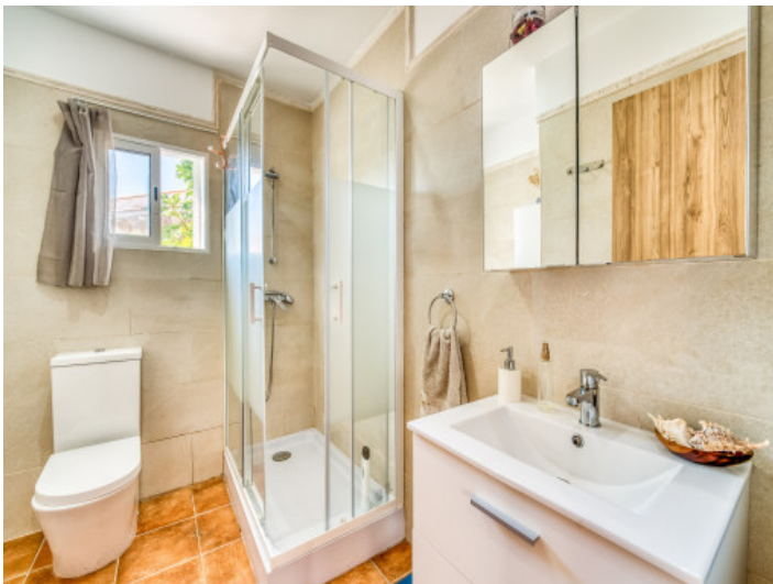
Eines von 2 Badezimmern