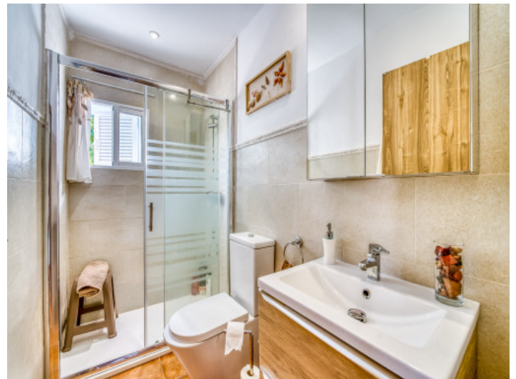
Eines von 2 Badezimmern