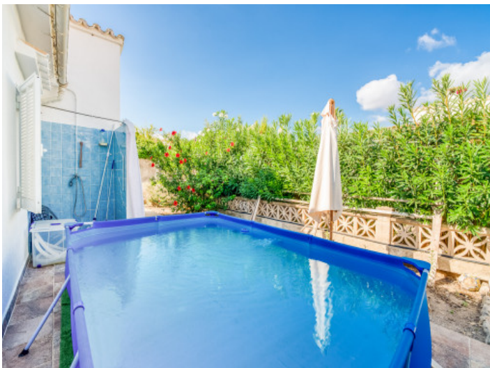
Terrasse mit Pool und Außendusche