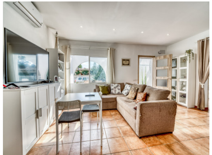
Eingangs- und Wohnbereich