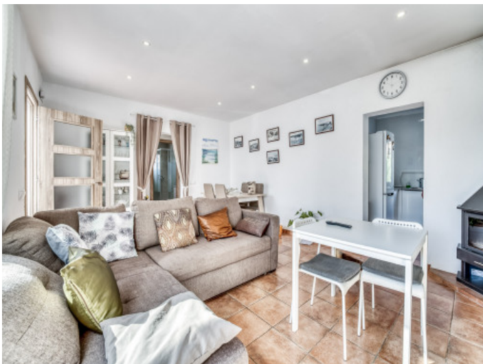
Heller Wohn- und Essbereich