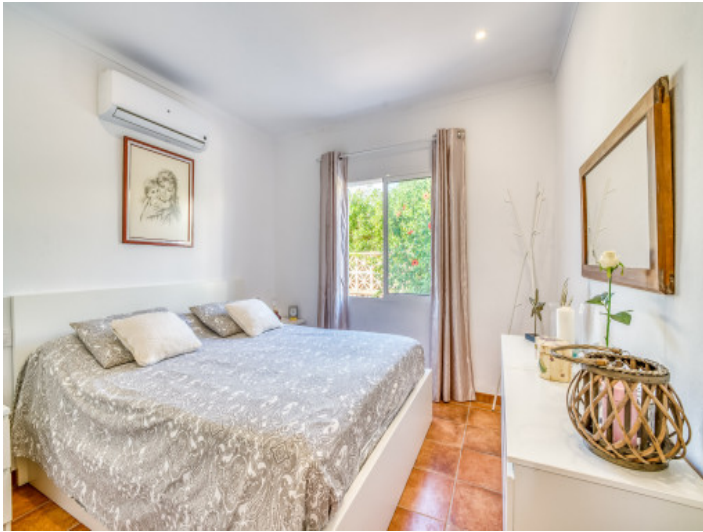
Eines von 3 Schlafzimmern