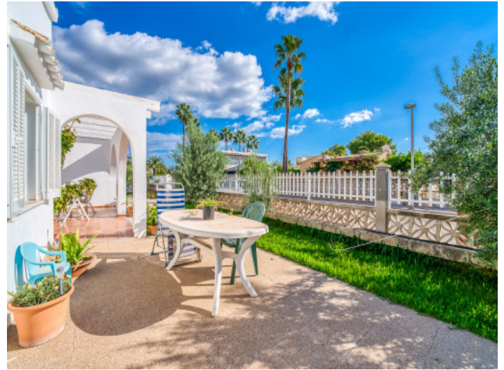
Schöne Terrasse auf der Vorderseite