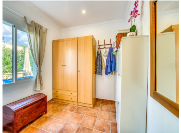
Eines von 3 Schlafzimmern