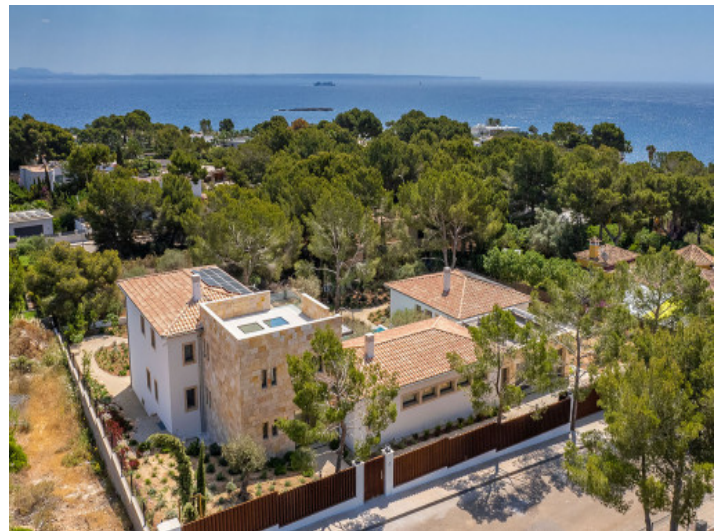
Nahe des Meeres