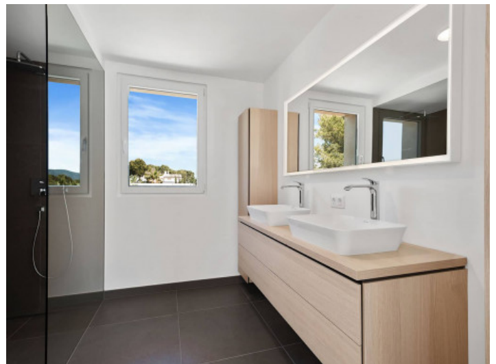
Eines der 4 Badezimmer

Alle Angaben nach bestem Wissen. Irrtum und Zwischenverkauf vorbehalten. Dieses Exposé ist eine Vorinformation, als Rechtsgrundlage gilt allein der notariell abgeschlossene Kaufvertrag.