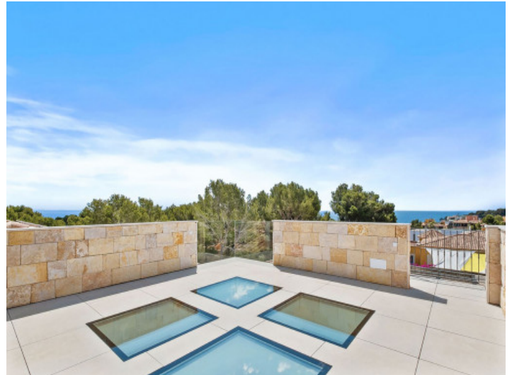
Der Turm mit Weitblick