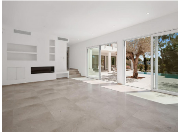
Offener Wohnbereich mit Gaskamin