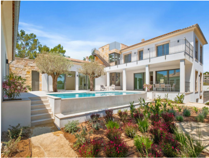
Ansicht der Neubauvilla mit Pool