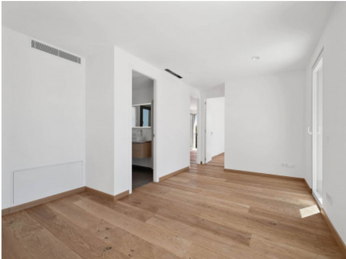
Eines der 4 Schlafzimmer