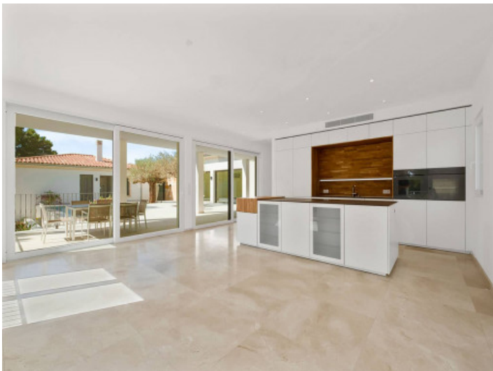
Blick zur voll ausgestatteten Küche