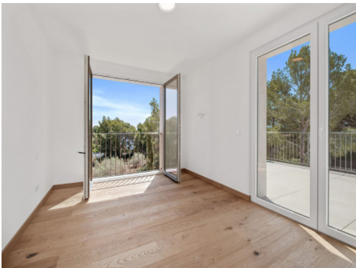
Eines der 4 Schlafzimmer