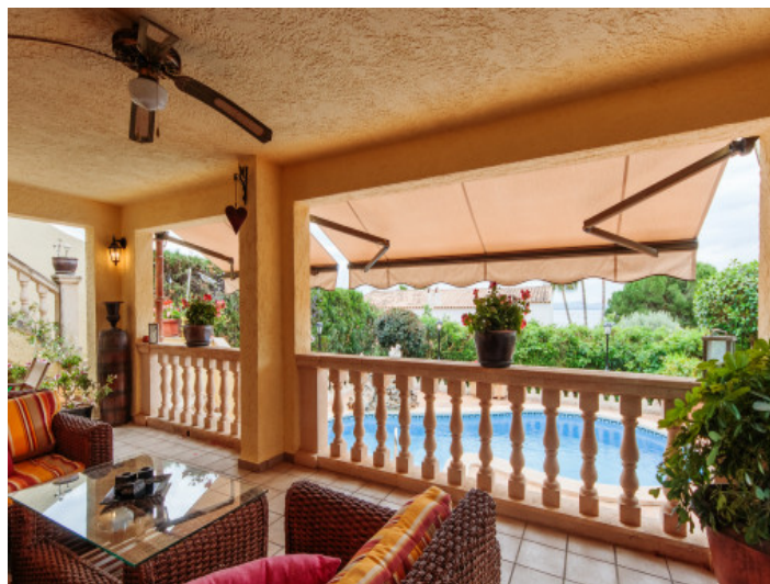
Überdachte Terrasse mit Blick über den Poolbereich