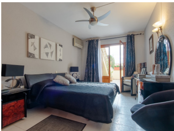
Doppelschlafzimmer mit Terrassenzugang