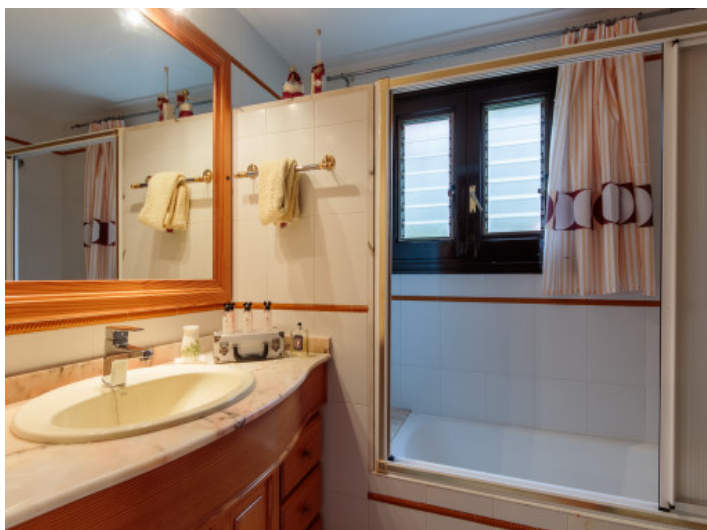
Badezimmer mit Badewann