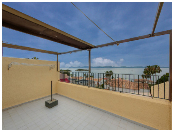
Dachterrasse mit Weitblick