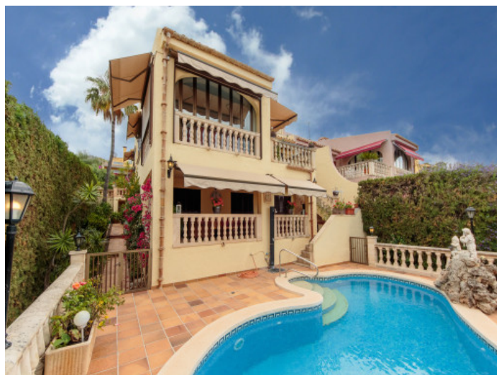
Fassade der Doppelhaushälfte

Alle Angaben nach bestem Wissen. Irrtum und Zwischenverkauf vorbehalten. Dieses Exposé ist eine Vorinformation, als Rechtsgrundlage gilt allein der notariell abgeschlossene Kaufvertrag.