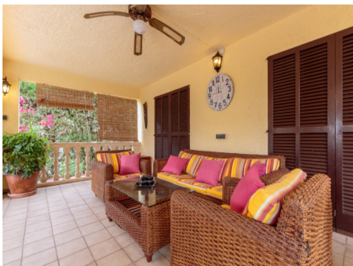
Terrasse mit komfortabler Sitzmöglichkeit