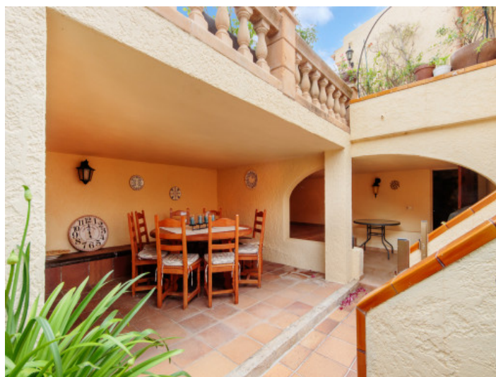
Essbereich im Freien