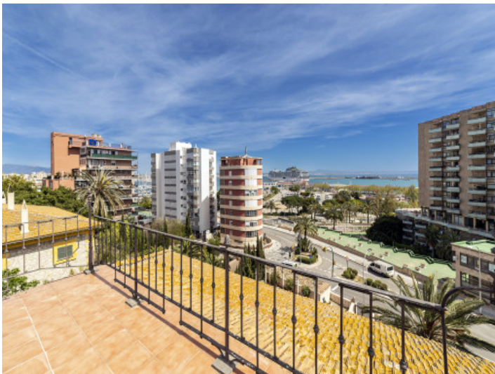
Große Terrasse mit Meerblick