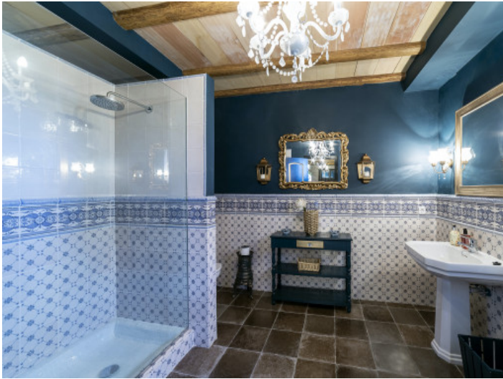
Eines von 5 Badezimmern