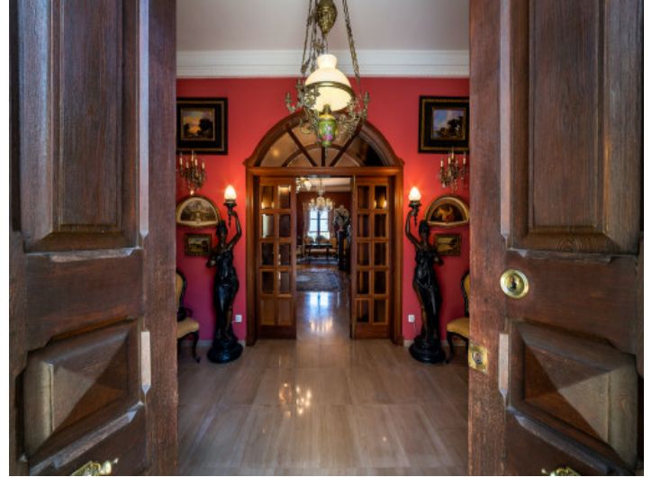
Eingang zur Villa