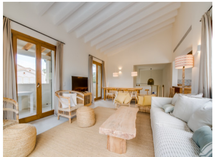
Heller, offener Wohn- und Essbereich

Alle Angaben nach bestem Wissen. Irrtum und Zwischenverkauf vorbehalten. Dieses Exposé ist eine Vorinformation, als Rechtsgrundlage gilt allein der notariell abgeschlossene Kaufvertrag.