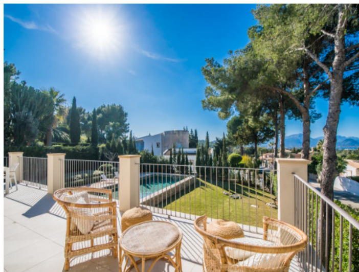
Obere Terrasse mit Blick auf den Garten