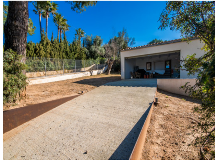
Alternative Ansicht der Garage

Alle Angaben nach bestem Wissen. Irrtum und Zwischenverkauf vorbehalten. Dieses Exposé ist eine Vorinformation, als Rechtsgrundlage gilt allein der notariell abgeschlossene Kaufvertrag.