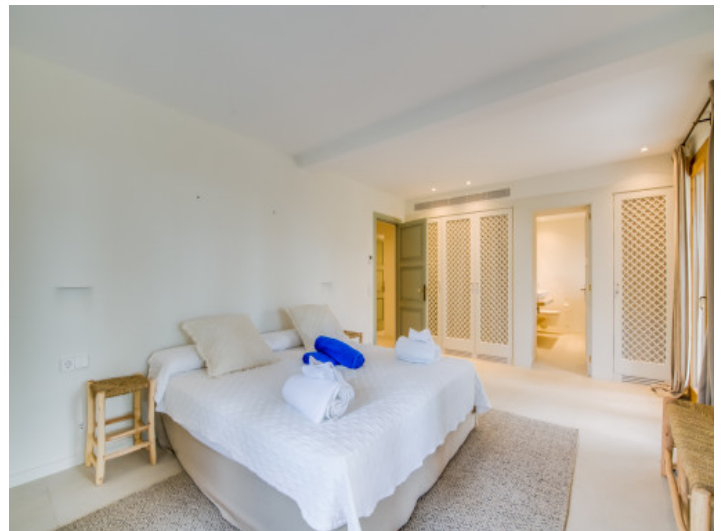
Schlafzimmer mit Badezimmer en Suite