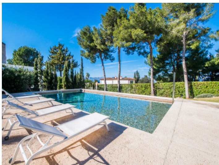
Sonnenliegen am Pool