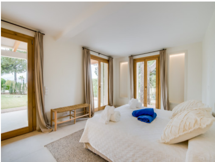
Schlafzimmer mit Gartenzugang