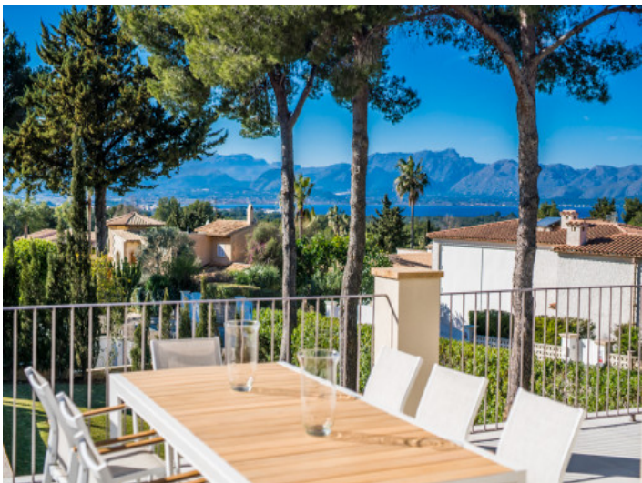
Blick auf die Bucht von Alcudia