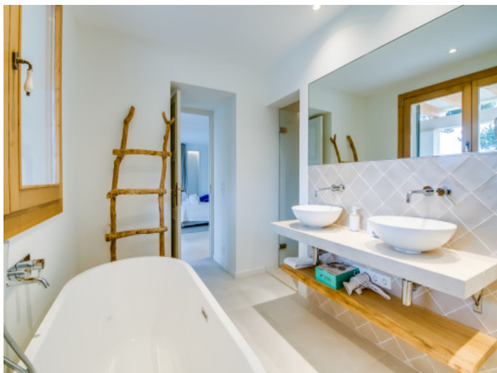
Modernes en suite Badezimmer