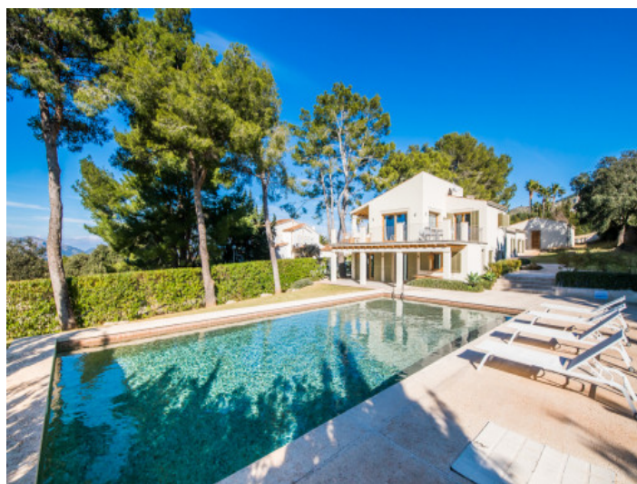
Großer Pool mit Sonnenterrasse