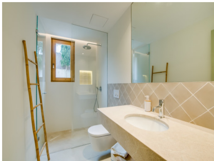
Weiteres Badezimmer mit Dusche