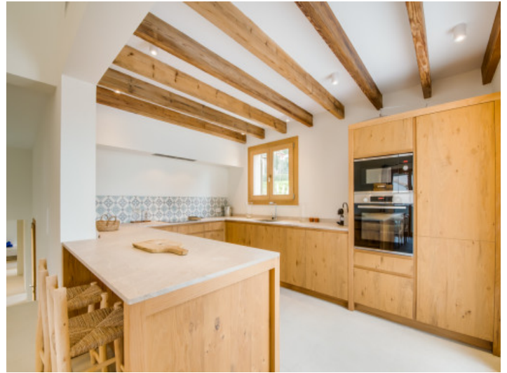
Neue Küche mit Holzbalkendecke