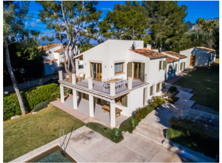
Blick auf die 2 Terrassen