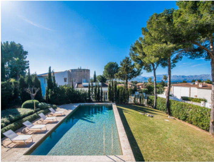
Moderner Poolbereich mit Sonnenterrasse