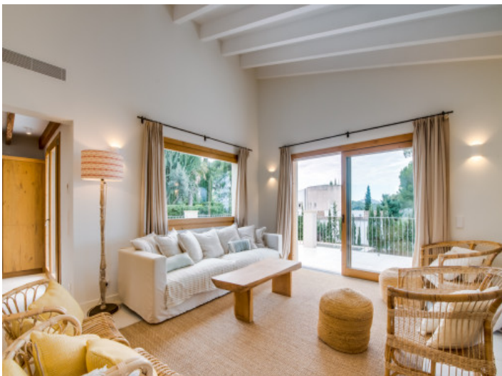
Schön eingerichteter Wohnbereich