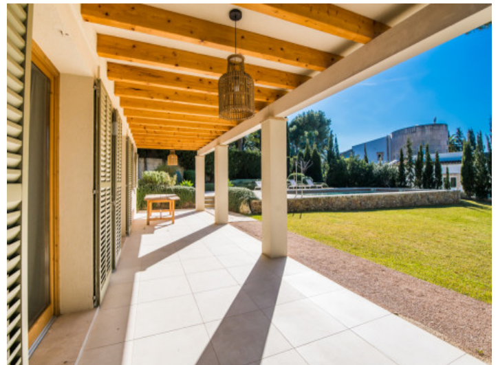
Überdachte Terrasse mit Blick in den Garten