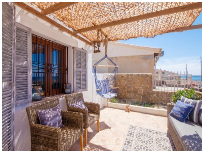
Sitzbereich auf der Terrasse