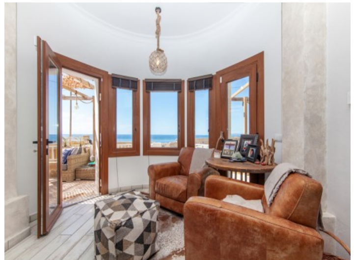
Lichtdurchfluteter Wohn- und Essbereich