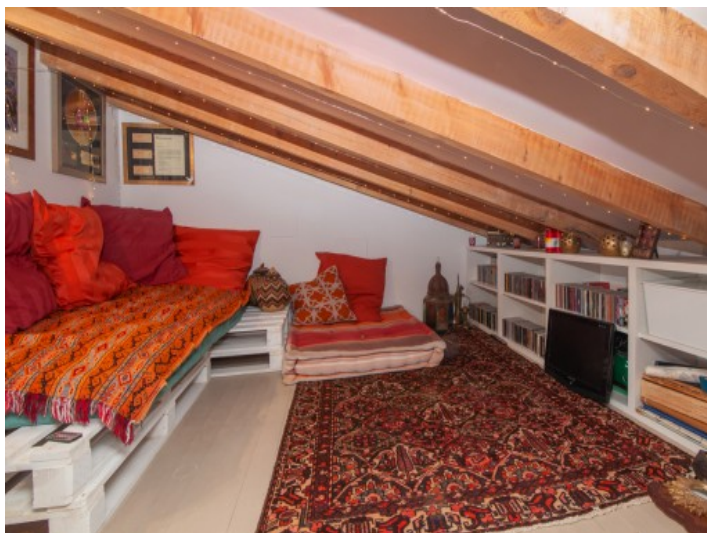
Alternative Chill-Out Area