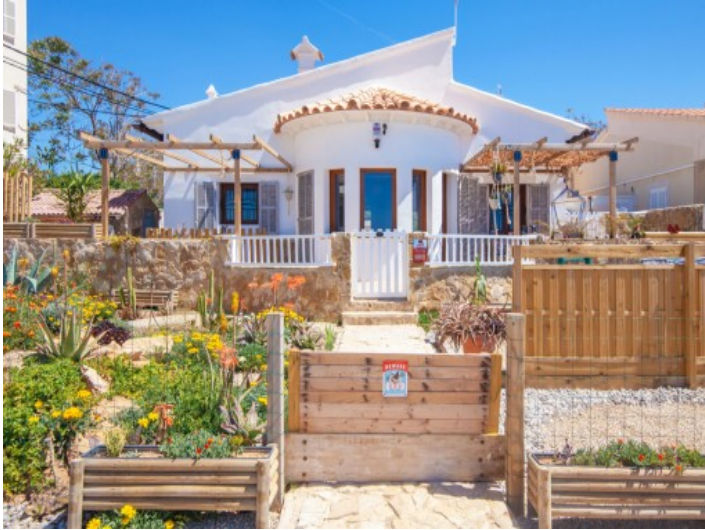
Außenansicht des Hauses