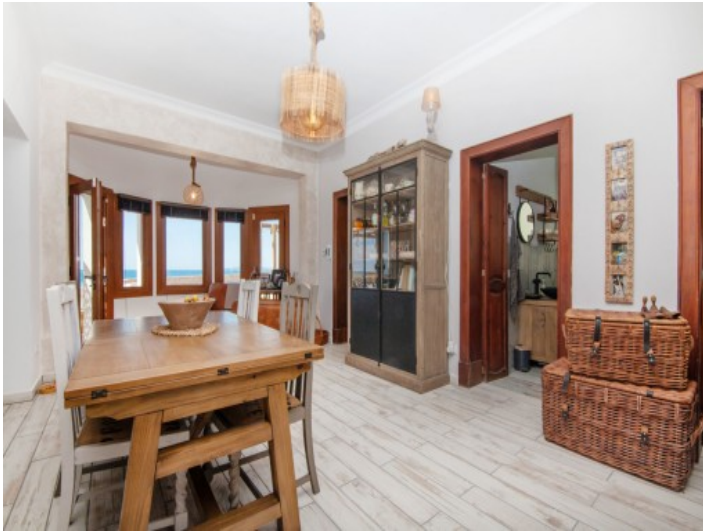
Lichtdurchfluteter Wohn- und Essbereich