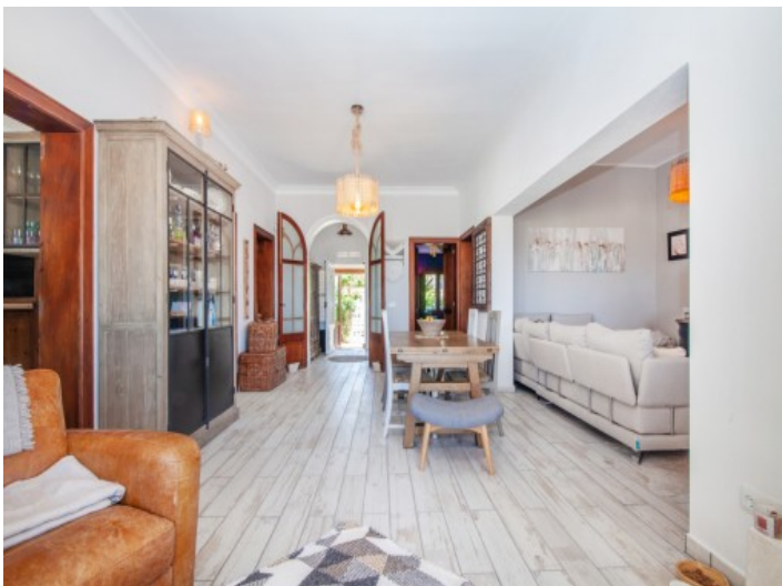
Lichtdurchfluteter Wohn- und Essbereich