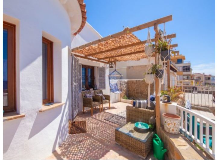
Sitzbereich auf der Terrasse