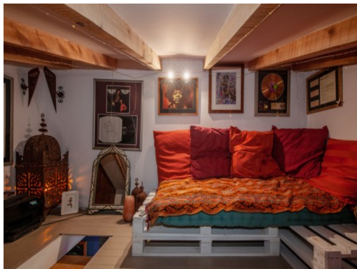
Alternative Chill-Out Area