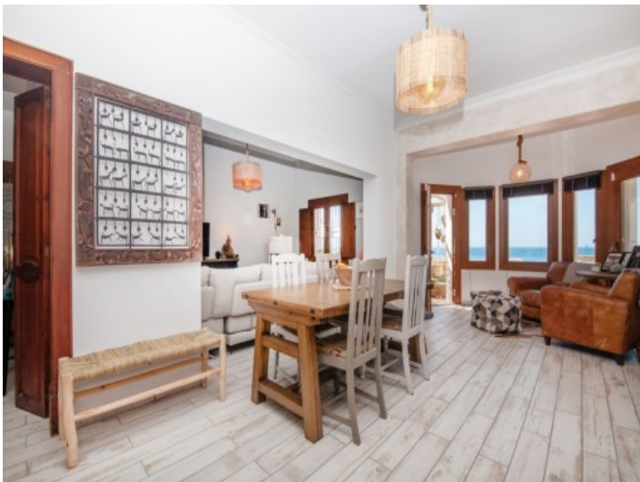
Lichtdurchfluteter Wohn- und Essbereich