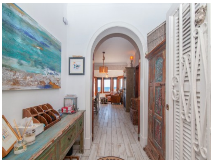
Ansicht des Flurbereichs