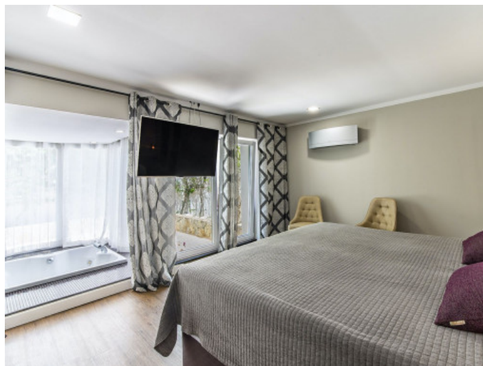
Schlafzimmer mit Bad en Suite