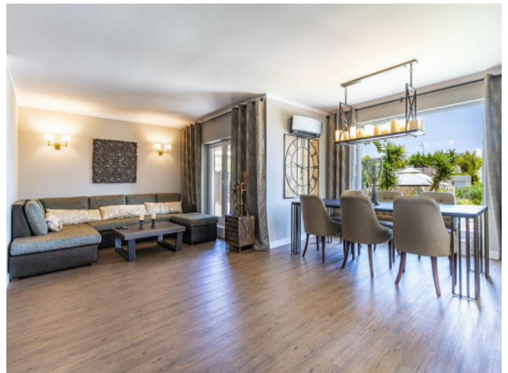
Offen gestalteter Wohn-/Essbereich