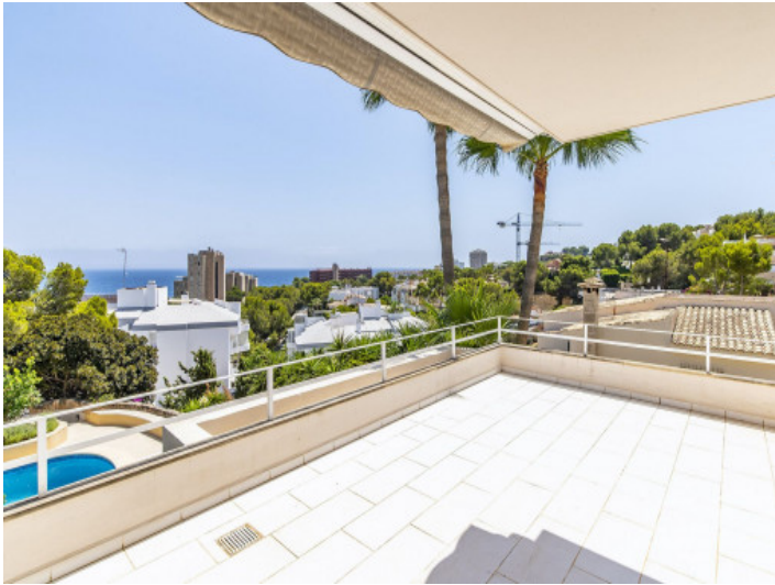
Überdachte Terrasse mit tollem Meerblick