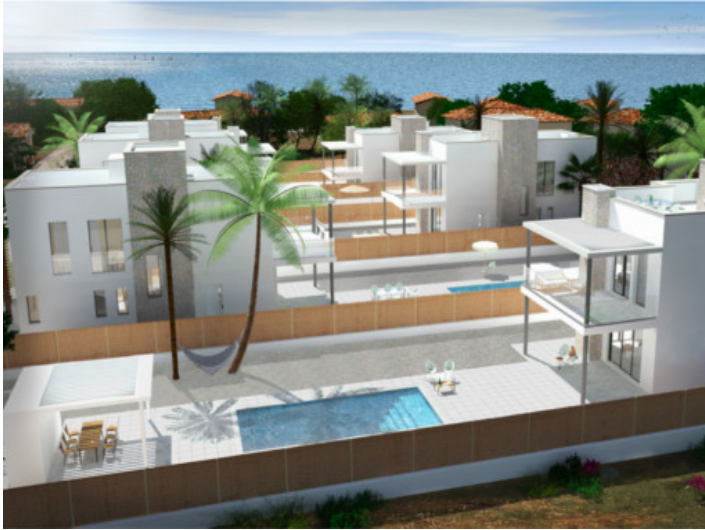
Alternative Ansicht des Bauprojekts